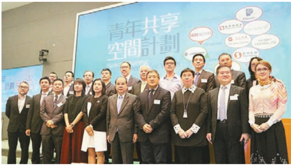
■特區政府與商界及多個非牟利機構合作推出的「青年共享空間計劃」，昨公佈詳情。

香港文匯報訊（記者 顏晉傑）高昂租金及人際網絡等都是青年創業面對的問題。特區政府與商界及多個非牟利機構合作推出「青年共享空間計劃」，最快明年上半年以不超過市值租金一半的價錢，出租共享工作空間，協助青年從事創新科技、創意產業及文化藝術工作，預計首階段計劃將有逾千人受惠。營運機構須每半年向業主和特區政府匯報租金及出租率等營運情況。