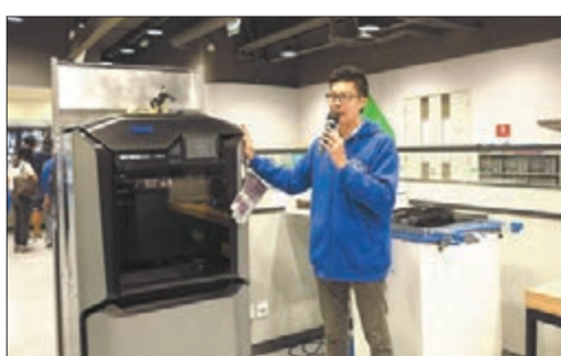
■其中一款3D打印機。