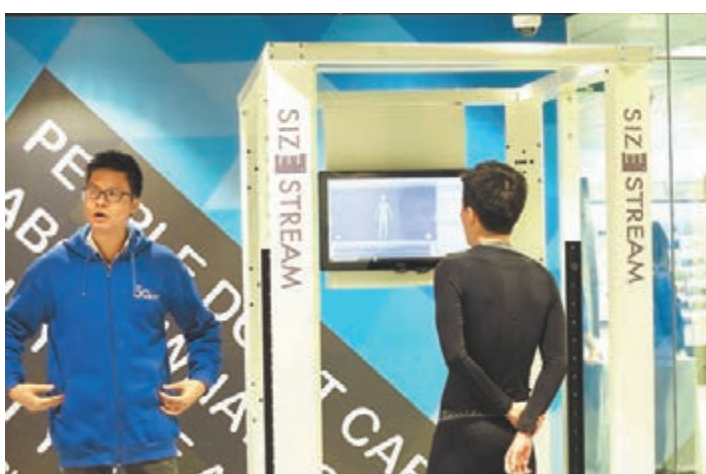
■場內設有先進的人體掃描儀。