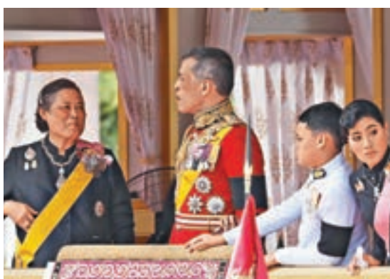
■ 詩琳通公主(左一)及哇集拉隆功等王室成員參加火化儀式。

泰國昨日為已故泰王普密蓬舉行遺體火化儀式。超過30萬身穿黑衣的泰國人放下所有事務，不畏烈日地聚集在曼谷王家田廣場一帶，希望向普密蓬致以最後的告別。火化儀式依照泰國王室傳統和佛教儀式舉行，由日出持續至日落，過程莊嚴而隆重，盡顯泰國人對普密蓬的尊敬。火化儀式標誌着被視為泰國「定海神針」的普密蓬完全離去，新王哇集拉隆功稍後將正式登基，也意味泰國王室和政局將走進全新時代。