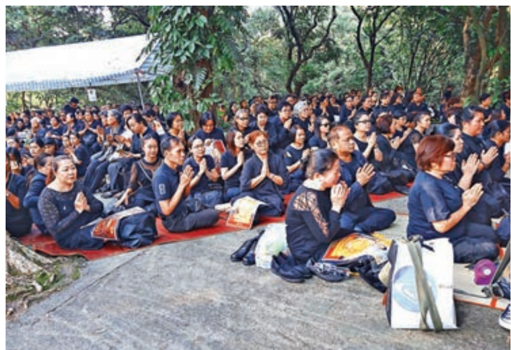
■ 身穿黑衣的出席者雙手合十聽高僧誦經，神情哀傷，部分人忍不住痛哭。