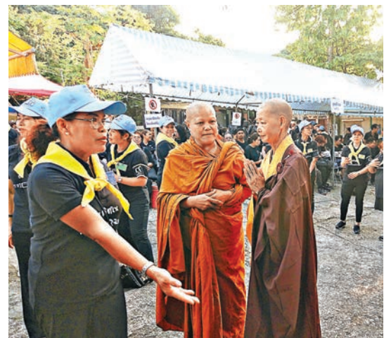
■ 僧人到場為已故泰王誦經。