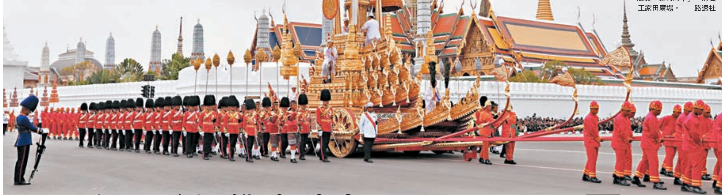
■ 立棺換乘泰國王室傳國之寶「勝利馬車」，前往王家田廣場。