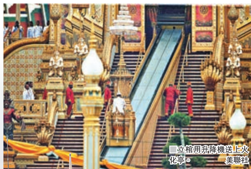
■ 立棺用升降機送上火化亭。