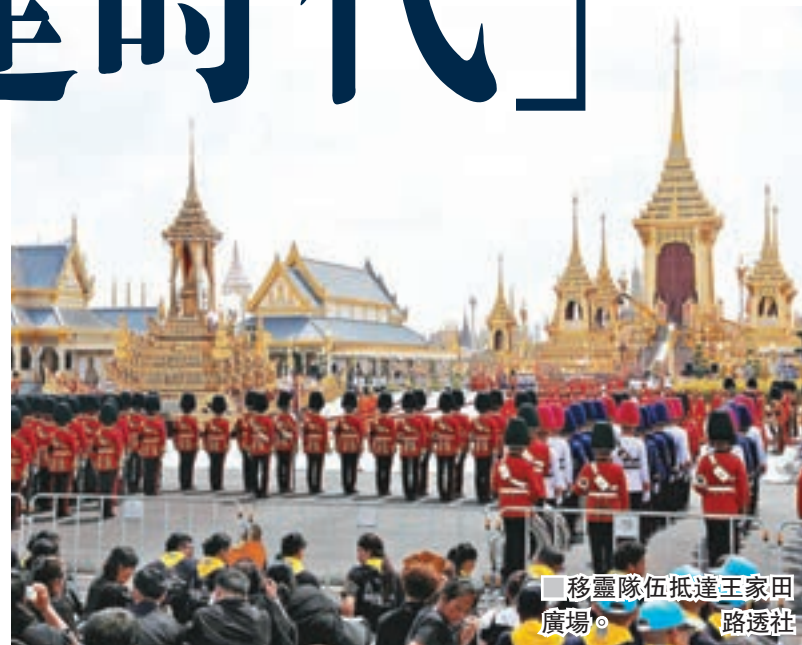
■ 移靈隊伍抵達王家田廣場。

多國王室成員及領導人代表昨日出席已故泰王普密蓬的火化儀式，其中中國由國家主席習近平特使、國務院副總理張高麗代表出席，其他國家出席代表包括不丹國王旺雅、新加坡總統哈利瑪、澳洲總督科斯科羅夫、日本文仁親王伉儷、英國安德魯王子、荷蘭王后、西班牙王后、瑞典王后及比利時王后等，美國則派出國防部長馬蒂斯為總統特朗普代表。 ■泰國《民族報》