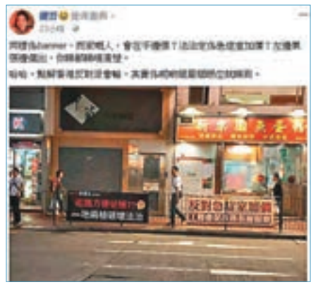
健吾寸麥德正幅 banner 又唔顯眼。fb 截圖

健吾前日嘅 facebook 些牙 (分享) 咗幅相，入面有一幅寫住「一地兩檢破壞法治」嘅 banner，同埋工聯會嘅反急症室加價 banner。健吾反問市民在乎邊幅多啲，「法定定係急症室加價」，又話「一地兩檢」嘅幅係邊個出睇都睇唔清楚，「點解香港反對派會