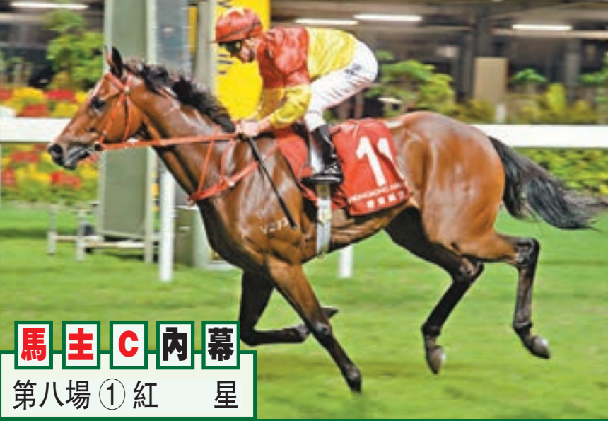
馬主C內幕 第八場①紅星

第三場、第四班、一八〇〇米。 「進綵」方廠中長途馬班底高，昔日曾評八十分時獲一贏兩位，事實上，上季初選評七十四分起步，經過連輸十六場後，卒在季尾跑五班谷草二千二勝回一仗；踏入今季官仔馬銳氣未減，今季兩戰谷草一哩及千八取得冠亞各一；今次打鐵