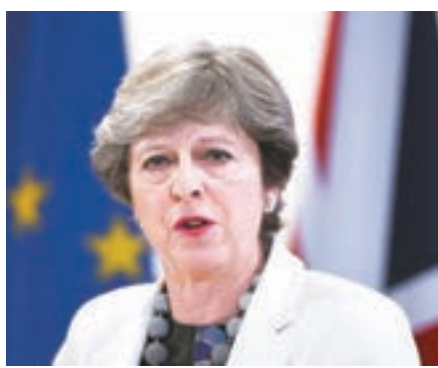
文翠珊飽受下台壓力。

德國報章《法蘭克福匯報》前日報道，英國首相文翠珊上週與歐盟委員會主席容克共晉晚餐，兩人討論到英國脫歐問題，容克披露文翠珊當時神情沮喪，並有一對很深的「黑眼圈」，對方透露其朋友和政敵企圖逼她下台，乞求歐盟在脫歐問題上為她製造空間，助她解決英方內部分歧。而在晚宴後，兩人便發表聯合聲明，同意加快脫歐談判。