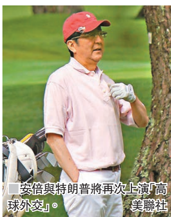
於2020年東京奧運高球場「霞關CC」展開協調。

重申兌現承諾 揚言強硬對朝 日本首相安倍晉三在眾議院選舉中打「朝鮮牌」爭取支持，他昨天重申會兌現競選承諾，指堅決對付朝鮮是其當務之急，將與美國、中國、俄羅斯合作應對威脅。他同日與美國總統特朗普普通電話，確認日美加強向朝施壓。