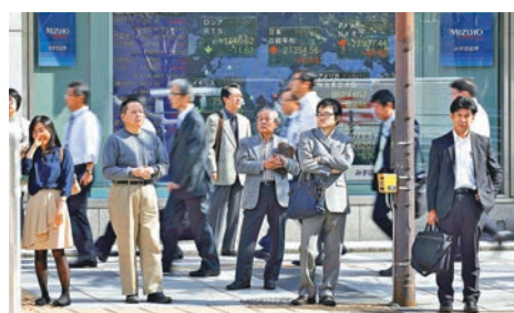
市場憧憬安倍將推出更多刺激經濟措施。彭博社

日圓匯價昨日回軟，兌美元一度跌至113.74，觸及7月中以來的低位。日圓兌每百港元則跌至6.83。 ■法新社/路透社/美聯社