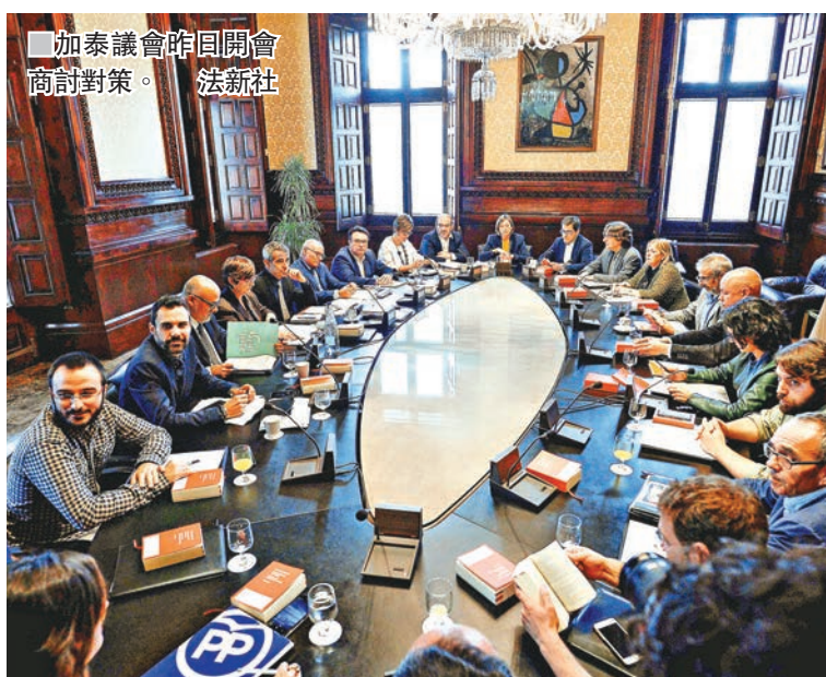
加泰議會昨日開會商討對策。法新社

CUP昨發表聲明，揚言若中央政府不理會加泰人民的獨立訴求，他們將發動大規模公民抗命，指責中央的計劃是自佛朗哥獨裁政權以來，對加泰的「最大侵略」。 ■法新社/路透社