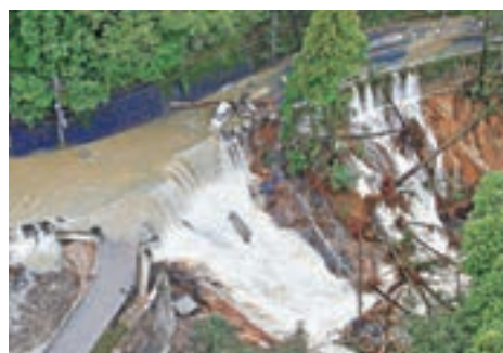
「蘭恩」造成多處水浸及山泥傾瀉，導致5人死亡。路透社

首相安倍晉三前日下令動員自衛隊參與救災，稱內閣會全力為災民提供緊急援助。颱風吹襲期間正值日本眾議院選舉，部分民眾恐天氣情況惡化，應當局呼籲提早到票站投票。 ■美聯社/法新社/路透社