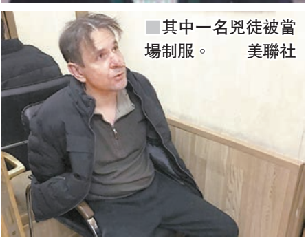
其中一名兇徒被當場制服。