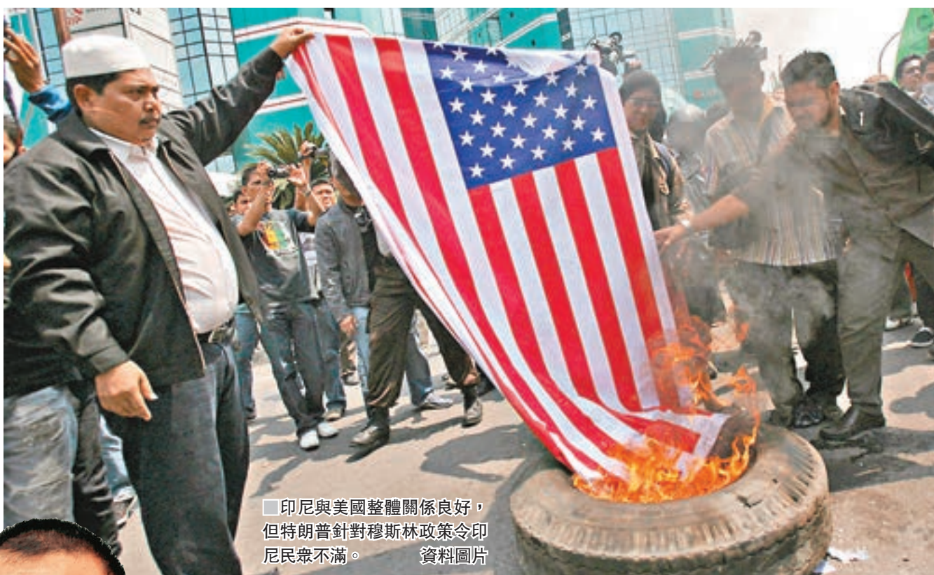
印尼與美國整體關係良好，但特朗普對穆斯林政策令印尼民衆不滿。