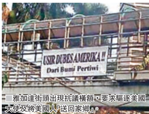
雅加達街頭出現抗議橫額，要求驅逐美國大使及將美國人「送回家鄉」。

與其中一名隨行成員有關，又形容事件「非常嚴重」。他指數名印尼軍官曾因為過往的軍事行動，而被美國拒絕入境，暫未知加托今次是否涉及同樣原因。