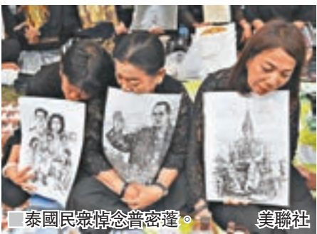
泰國國民悼念普密蓬。