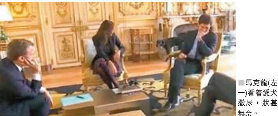
馬克龍(左一)看着愛犬撒尿，狀甚無奈。