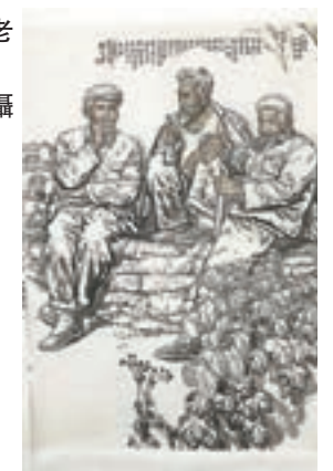
《陝北老農》部分。