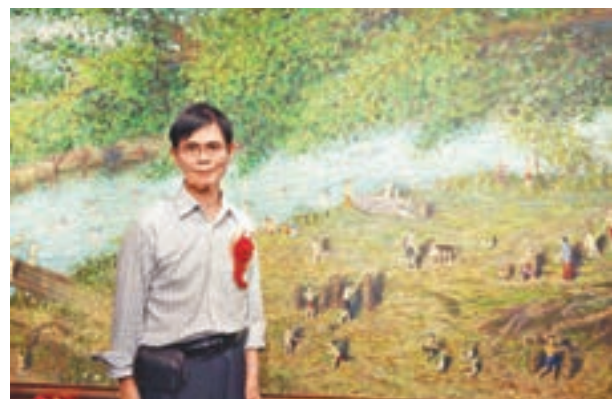
港人蔡騰歷時三年創作的油畫《鄉村舊事》，目前拍賣公司估價達2億元人民幣。