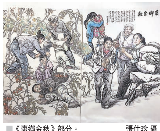
《棗鄉金秋》部分。