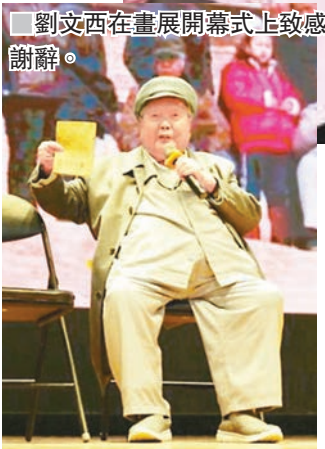
劉文西在畫展開幕式上致謝辭。

據了解，此次展出的劉文西百米長卷《黃土地的主人》長102米，高2.1米，由《黃土地娃娃》、《陝北老農》、《米脂婆姨》、《綏德的漢》、《麥收場上》、《喜收包穀》、《葵花朵朵》、《高原秋收》、《棗鄉金秋》、《蘋果之鄉》、《安塞腰鼓》、《橫山老腰鼓》、《紅火大年》等13個部分組成。作品熱情歌頌了黃土地人民艱苦奮鬥，開拓創新，奔向美好幸福生活的輝煌歷程，集中凸顯了黃土高原的風情文化，刻畫出陝北人民