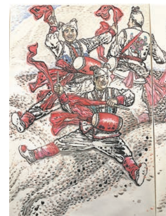
《安塞腰鼓》部分。