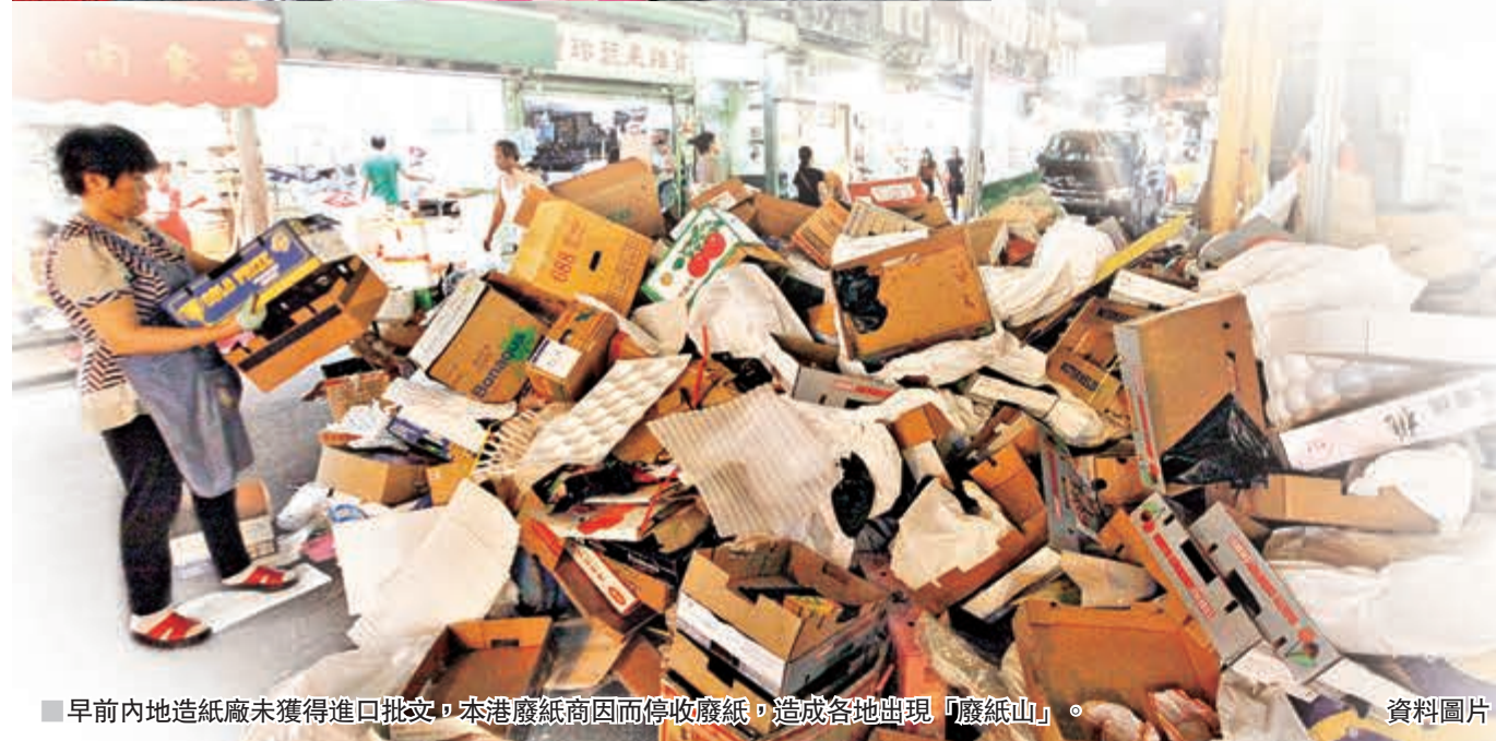
早前內地造紙廠未獲得進口批文，本港廢紙商因而停收廢紙，造成各地出現「廢紙山」。 資料圖片