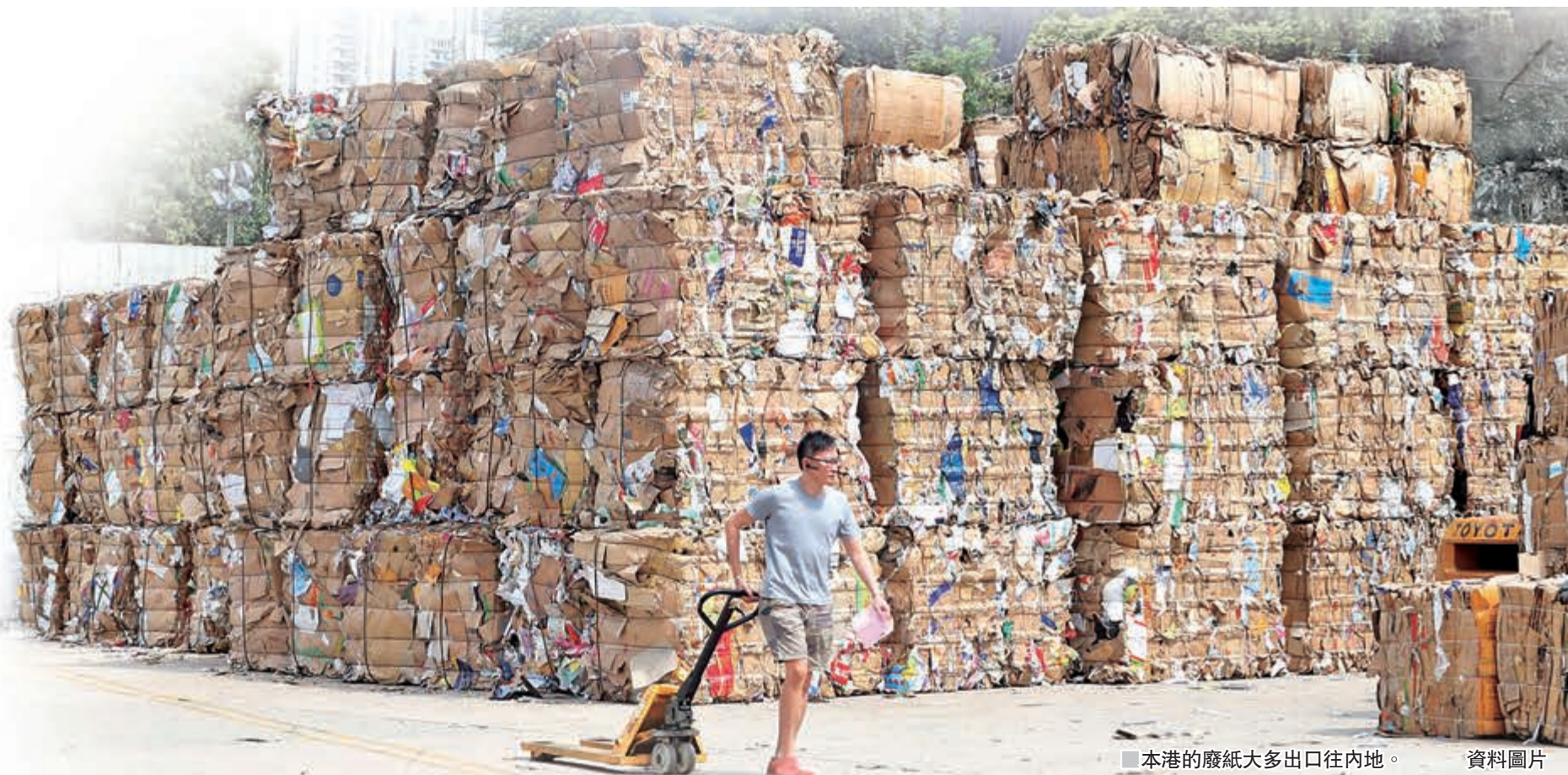
本港的廢紙大多出口往內地。 資料圖片

香港一直以來是外國廢料進口內地的中轉站，回收業界生存極度依賴內地市場。直至近月內地政府宣佈收緊廢料進口政策，計劃於今年年底起禁止入口廢塑料和未經分揀廢紙等24類固體廢物。此外9月上旬，由於內地造紙廠久未獲得今年第四季的進口批文，本港回收商堆積了近4,000噸廢紙未能出口；加上外國經香港中轉到內地的廢紙陸續運抵，本港隨時出現廢紙圍城的困境。到底內地政府收緊廢料進口政策，會為本港的回收及堆填問題帶來哪些影響？在本港發展回收業又有何困難？下文逐一深入探討。 ■鄭梓康 特約作者