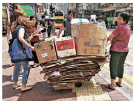
香港一些老人靠撿拾廢紙維生，暫停回收廢紙恐怕會影響這些老人的生計。

美國一些城市如西雅圖透過持續的公眾教育，維持高的回收率。在西雅圖提供垃圾收集服務的公司如果觀察到了某家庭棄置了較多的可回收廢物，收集人員會留下一個標籤，要求戶主先行把廢物分類回收；收集人員在該次並不會把垃圾棄置。一星期後，收集人員會再來巡視。雖然西雅圖沒有就未分類的垃圾徵收罰款，但透過持續的教育，西雅圖的高回收率得以保持。