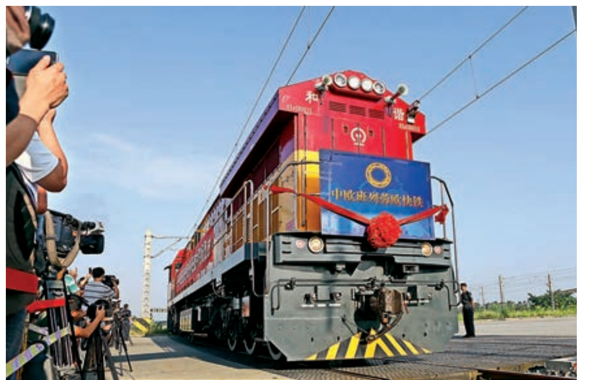
中歐班列蓉歐快鐵

和成都建設國家西部金融中心專場推介會，則開啓了蓉港合作的新起點，將成都與香港在經濟貿易、科技創新及藝術文化方面的交流合作不斷升級。