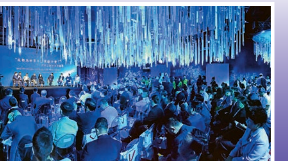
成都建設國家西部文創中心專場活動

一方面，成都正式對外發布了《西部文創中心建設行動計劃》（2017—2022年），倡議蓉港兩地構建文創產業合作新機制、探尋文旅融合發展新模式、培育文旅產業發展新生態，共築具有國際競爭力的文創產業要素集聚地，並希望以香港為支點，將成都建設國家西部文創中心、世界旅遊目的地城市的歷史機遇推向全球。