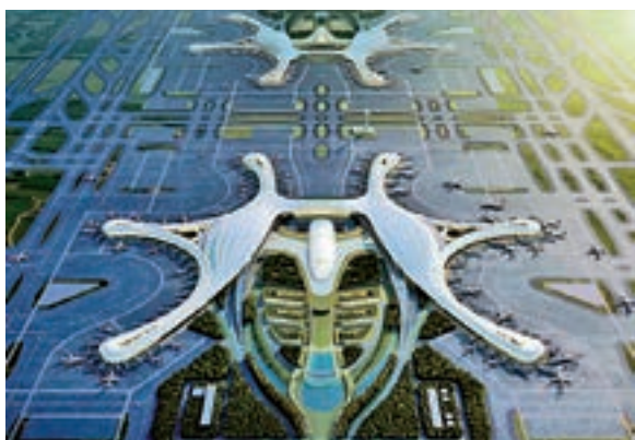
建設中的成都天府國際機場

「變革中的中國」第一集為何會聚焦成都？「開放」為何會成為外國人眼中成都的「關鍵詞」？外籍主持人在片中給出了答案：「成都正在日漸成為中國西部的國際化中心，這裏充滿了創新和機遇，搭建了中國與世界的開放橋樑，其開放程度遠超城市本身的生活節奏。」見微知著，成都已成為中國開放的一個縮影。從區域中心城市到國家中心城市，再到世界城市的「三步走」戰略規劃，讓成都都以「更全面、更深入、更務實」的新開放觀，全面提升國際交往便利度和交流合作緊密度，增強國際資源要素的吸附力，建設國家內陸開放型經濟高地和國際友好往來門戶城市。