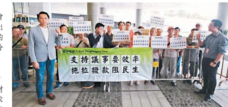
「政中香港人」到立法會請願反拉布。

「政中香港人」十多名成員到立法會請願,手持「議會討論正常化,政治不再礙民生」、「議員受薪有責任,任意妄為要不得」和「無聊無謂亂拖拉,浪費香港人時間」等標語。他們批評,反對派議員拉布導致多項民