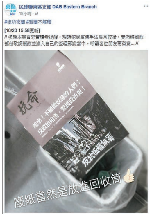
民建聯東區支部近日發帖，上載一張街坊將有關單張撕爛再丟到垃圾桶的照片。

國歌法已在內地頒佈實施，香港反對派中的工黨，近日在派發宣傳「雙學三丑」等所謂「政治犯」的單張中，印上了經修改的國歌歌詞。民建聯東區支部近日發帖，上載一張街坊將有關單張撕爛再丟到垃圾桶的照片，其後有人提醒可能是反對派的好計，就是屈辱國歌有關單張者「侮辱國歌」。