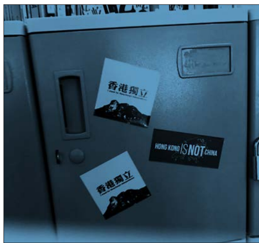
一名自稱「低form」的女學生在fb分享照片，稱在學校儲物櫃上張貼「香港獨立」與「Hong Kong is not China」貼紙。涉事女生fb相片

香港文匯報訊（記者 姬文風）中學生播「獨」組織「學生動源」不久前聲稱，再次啟動「『港獨』入校計劃」，一名疑為「學生動源」成員、就讀培基書院的女學生，從「學生動源」召集人鍾翰林處取得「港獨」貼紙後，以「儲物櫃是自己地方」為由，在校內張貼「播獨」。有看不過眼的同學認為此舉不妥，遂將貼紙撕走。女生卻聲言「你撕一張，我痴（竊）一張」，此舉獲得辱華前科的中大前學生會會長周堅峰留聲力撐。有教育界人士指事件明顯反映「獨」害已再度滲透校園，各界務必正視。