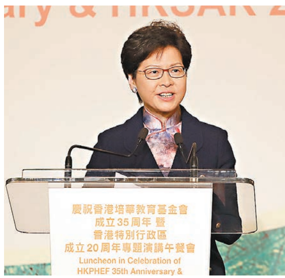
林鄭月娥強調，培養學生國家觀念是學校教育應有之責。

香港文匯報訊（記者 鄭洽祖）行政長官林鄭月娥在施政報告中提出，將中史科在初中成為獨立必修科。她昨日強調，讓學生認識自己國家歷史、文化、經濟等各方面的發展，培養他們的國家觀念，是學校教育應有之責。教育局會繼續採取多元化措施，促進師生全方位認識國情，並會優化內地交流計劃，讓更多老師跟學生藉實地考察，理解國家的發展策略為香港帶來的機遇，和拓寬他們的視野。