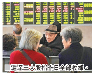
滬深三大股指昨日全部收綠。

期、政府債券發行繳款和逆回購到等影響,央行昨又開展了1,400億元(人民幣,下同)逆回購操作。鑒於有400億元逆回購到期,故單日實現淨投放1,000億元。