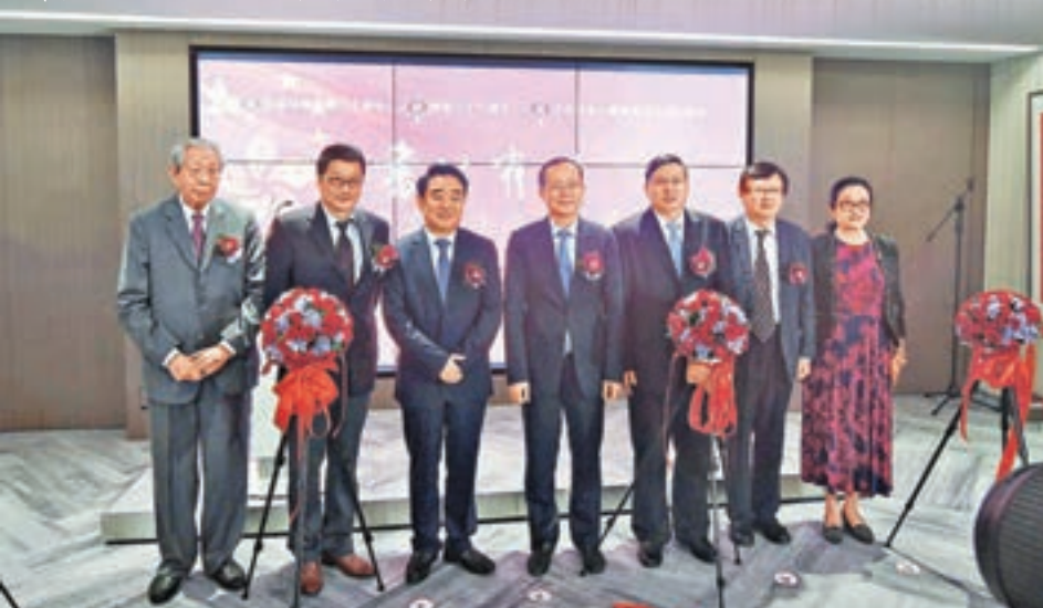
展覽開幕當天，多位重量級的嘉賓出席捧場。