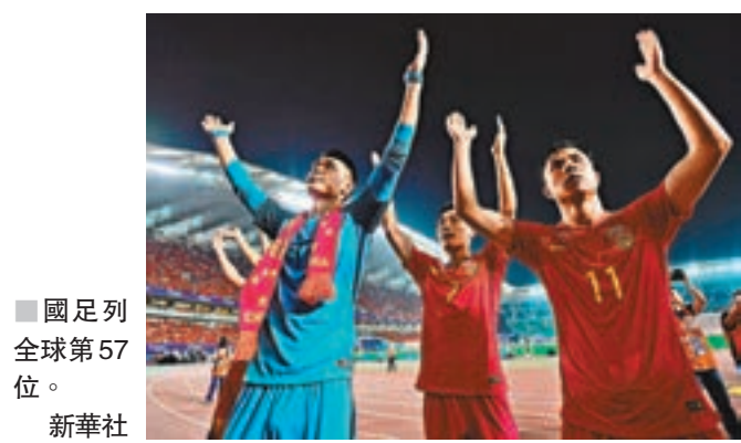
■國足列全球第57位。

日前，國際足協公佈了最新一期排名。憑世界盃外圍賽連勝烏茲別克和卡塔爾，國足排名積分增加62分，最新積分達到626分，總排名上升5個位次，列全球第57位，12年來首次重返前60行列。這也是國足自2005年以來的最高排名。在亞足協榜單上，國足成功超越