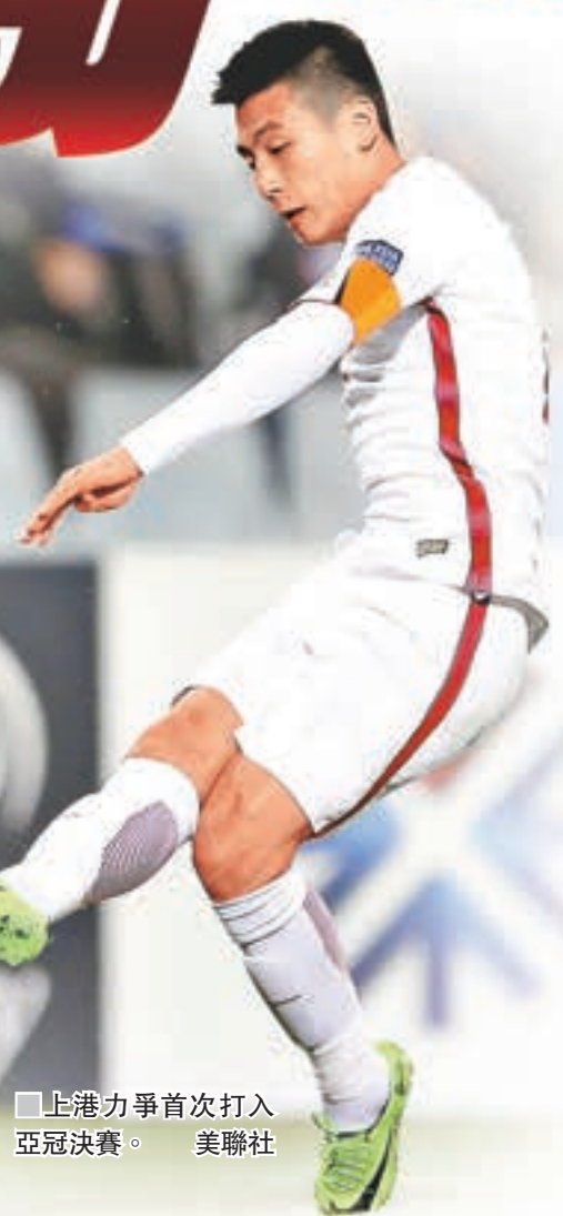
■上港力爭首次打入亞冠決賽。美聯社