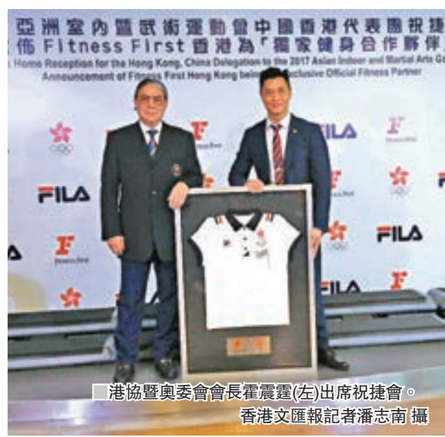
■港協暨奧委會會長霍震霆(左)出席祝捷會。

香港文匯報訊(記者潘志南)香港隊剛於今屆亞室運奪得10金11銀14銅共35面獎牌，於總成績名列第10名，成績驕人。港隊昨日於觀塘舉行祝捷會並向一眾運動員頒發紀念品，同時宣佈Fitness First成為港協暨奧委會的獨家健身合作夥伴，為期3年。