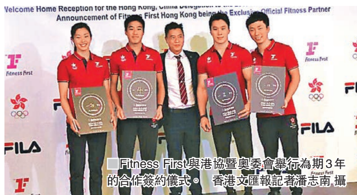
■Fitness First與港協暨奧委會舉行為期3年的合作簽約儀式。

出席是次祝捷會有港協暨奧委會會長霍震霆、亞室運港隊團長劉掌珠、副團長胡曉明、港協暨奧委會義務秘書長王敏超、民政事務局體育專員楊德強及康樂及文化事務署助理署長(康樂事務)黃達明，以及一眾港隊亞室運功臣。