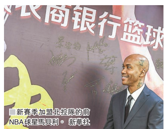
■新賽季加盟北控隊的前NBA球星馬貝利。

CBA公司官方昨日發佈公告，2017-18賽季的CBA將推遲一周開賽，首場比賽將在10月28日開打。CBA公司具體發佈內容如下：「各賽區，各俱樂部，各相關機構，綜合各地情況，經與有關各方溝通，決定調整2017-2018賽季CBA聯賽開賽日期及賽程，開賽日期調整為2017年10月28日。調整後的2017-2018賽季CBA聯賽賽程稍後下發。」