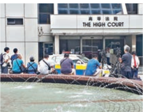
傳媒在高等法院外面守候消息。