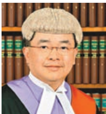
遭亮刀指嚇高院法官陳嘉信。