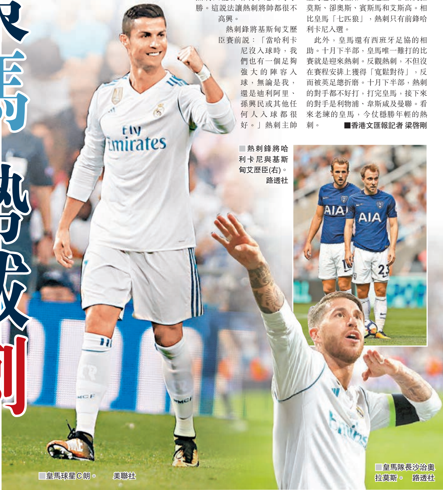
皇馬球星C朗。