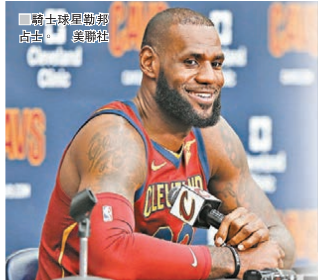
騎士球星勒邦占士。