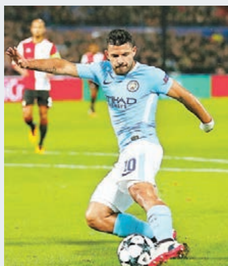
曼城主場射門阿古路。

歐聯F組明晨上演大戰，英超「一哥」曼城將在主場迎戰意甲「一哥」拿玻里；目前兩隊狀態極佳，不過曼城今仗坐擁主場之利，看好他們能全取3分。(有線64及203台周三2:45a.m.直播)