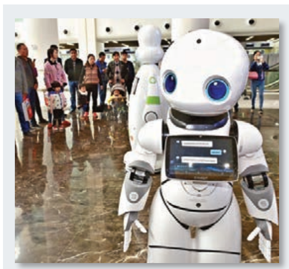
機械人導診 導診機械人昨日正式上崗，為求診患者提供導醫查詢服務。當日，在安徽醫科大學第一附屬醫院高新區分院門診部，機械人變身醫院導診員，為求診患者提供導醫查詢等服務。

游行業價格顯著上升，造紙業、化學製藥業、化學纖維製造業價格環比分別3.4%、1.9%、1.9%，同比漲幅達到13.8%、10%、10.9%。劉學智預計，隨着去產能工作持續推進，環保限產力度加大，供給收縮對工業產品價格形成支撐。由於大宗商品價格難以繼續大幅上升，翹尾因素走弱，PPI不會持續大幅攀升。綜合判斷，四季度PPI可能在6%之上，全年PPI平均漲幅約6.4%左右。值得注意的是，此前公佈的9月製造業PMI持續上升，加之工業企業利潤持續改善。劉學智認為，這表明工業領域需求保持較好，經濟運行有望保持平穩。