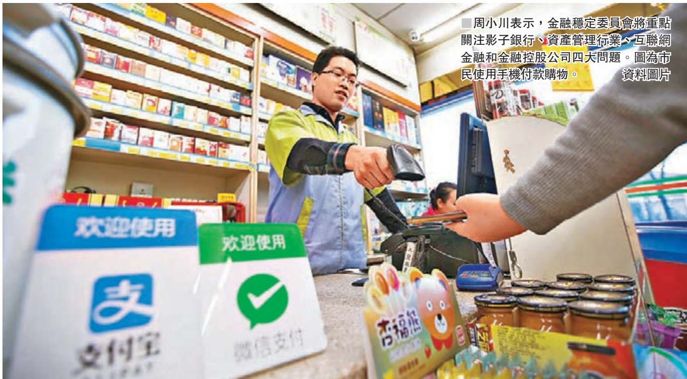
周小川表示，金融穩定委員會將重點關注影子銀行、資產管理行業、互聯網金融和金融控股公司四大問題。圖為市民使用手機付款購物。資料圖片

同時，得益於外部環境的改善，今年以來中國進出口表現較好，經常項目順差預計今年佔GDP比例將降至1.2%。從國際比較看，中國國際收支不平衡程度較低。周小川還指出，從貨幣供應和信貸數據看，今年初以來，內地已進入去槓桿進程，廣義貨幣供應量M2增速持續放緩，當前已低於9%。整體槓桿率開始出現下降。雖然幅度不大，但趨勢已經形成。在去產能方面，周小川表示，內地已開始削減鋼鐵和水泥行業的過剩產能。中國政府希望推動結構改革和優化，高度重視