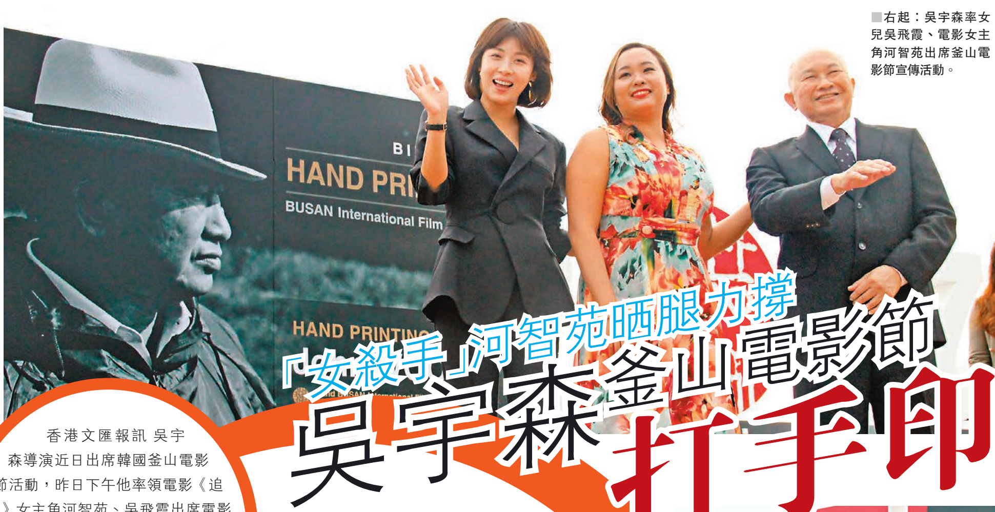
右起：吳宇森率女兒吳飛霞、電影女主角河智苑出席釜山電影節宣傳活動。