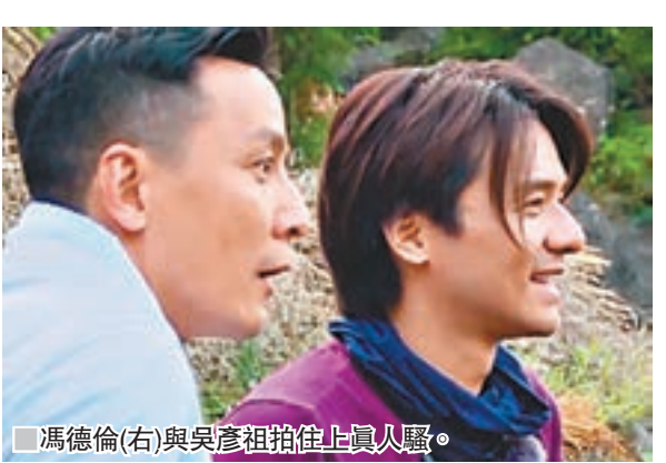
馮德倫(右)與吳彥祖拍住上真人騷。