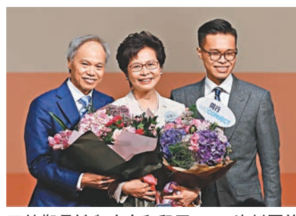
林鄭月娥與丈夫和兒子。

林鄭月娥在節目上被主持人問及決定選特首時有無遲疑,上任後又有無後悔時坦言,特首每日需要工作十六七個小時,自己都想「煮吓飯、去吓旅行、睇吓書」,但出任特首是崇高的工作,特別是香港有良好發展機會,自己會盡力為香港服務,希望現屆政府可有熱情,