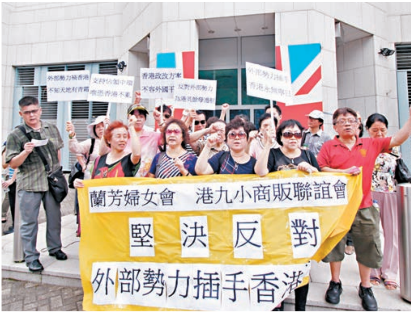
團體早前到美國及英國駐港領事館門外抗議,表示對外國勢力干預香港事務的不滿。

她說:「在基本法及『一國兩制』下,香港特別行政區享有高度自治,包括入境政策及海關等方面。但當涉及外交,就是中央政府處理的事務,所以個