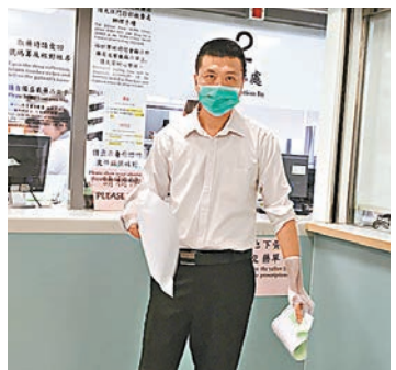
手掌灼傷學警送院救治。

香港文匯報訊(記者 蕭景源)西貢科技大學揭發連環刑毀案,校內多達89幅宣傳學生活動的橫額及海報,一夜間被人鏢爛破壞,警方已列作刑事毀壞案,交由將軍澳警區刑事調查隊跟進,初步不排除涉案者不只一人,正翻查現場的閉路電視蒐證及調查動機,暫時無人被捕。 被破壞的橫額及海報,據悉均是與學生會內一個會社的活動