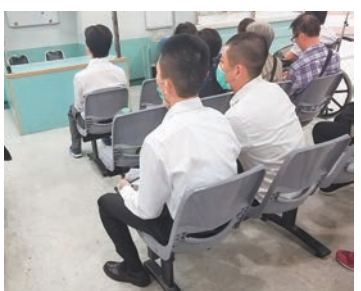
5名男學警報稱在烈日下做掌上壓時灼傷,但當日並無酷熱天氣警告。

香港文匯報訊(記者 蕭景源)香港警察學院昨日發生罕見意外,5名男學警報稱在烈日下接受掌上壓體能訓練期間,雙手掌難抵地面高溫灼傷,分送兩間醫院救治。根據天文台記錄,昨日區內錄得的最高氣溫為攝氏31.4度,全日並無發出酷熱天氣警告。 5名受傷的男學警,送院時可見雙手掌不同程度灼傷,其中兩人的手掌更要用無菌膠紙包裹,防止傷口受到感染,各人經治療後,幸無大礙。學院目前正調查肇事原因。 現場為香港仔黃竹坑海洋公園道18號「香港警察學院」。昨日下午1時許,一班男學警在校內接受掌上壓體能訓練,據悉當時雖然烈日當空,但有風,未算炎熱。其間有學警在完成掌上壓後,陸續報稱因地面高溫,致雙手掌灼傷出現紅腫及疼痛。 教官其後了解情況,證實共有5名男學警的手掌出現不同程度灼傷,於是通知校方召來救護車為各人檢查,最後兩人要送往律敦治醫院救治,另外3人則送往瑪麗醫院救治,各人由教官陪同,可自行上落救護車。 警察公共關係科回應稱案件暫列作「有人意外受傷」處理。強調警察學院有一套完善的訓練安全守則,若有學員在訓練期間意外受傷,學院會根據個別情況作出跟進。 有皮膚科醫生指,人體皮膚灼傷,主要由溫度、時間及器皿傳熱速度等因素造成。根據天文台記錄,昨日錄得的最高溫度為攝氏31.4度,中午1時錄得的溫度則為攝氏31度,相對濕度57%。