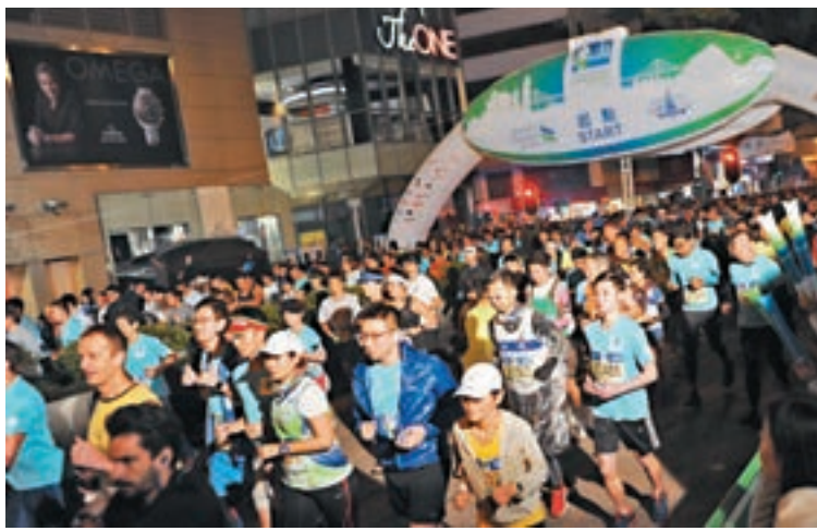
大會基於安全考量決定准許支票付款報名。資料圖片

香港文匯報訊(記者 文森)8月開始接受報名的渣打香港馬拉松,近日傳出有參加者的信用卡被盜用,出現多次不明交易,損失由數千元至萬多元不等。有網民反映,除了渣打馬拉松參加者外,也有其他賽事的參加者「中招」。聲稱被盜信用卡資料的市民表示,涉及的信用卡來自不同的發卡機構,交易系統包括PayPal等。主辦單位香港業餘田徑總會主席關祺表示,會與付款交易承辦商開會,了解事件。渣打香港馬拉松籌委會昨晚表示,第二輪公眾抽籤報名付款程序接受以郵寄支票方式繳交報名費。