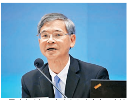
羅致光強調,資助安老院舍人手空缺率高達逾18%,人手不足問題相當嚴重。

可減至一兩個。 他指出,當局會在加薪後檢視空缺率會否下跌,再決定是否需要為資助院舍安排輸入外勞,並承認已收到有資助院舍要求輸入外勞:「相信不用等太久,我們會為院舍安排招聘會以新薪酬水平聘人,也要與非政府機構商討培訓等安排。」不過,如透過加薪等多項措施令空缺率跌至不足10%,便可暫緩輸入外勞。 在行政長官答問大會上,行政長官林鄭月娥指,現在勞動力需求最大的是安老服務,特別是安老院舍的工作,「如果要照顧到長者,儘管我們投入資源,儘管我們可以興建多些院舍,但如果沒有人手都難以解決。」 她強調,政府對於輸入勞工的立場一向都是不影響本地勞工就業和權益,亦不影響他們的工資的前提下,按着個別行業需要而且是非常緊迫的需要,有限度、有