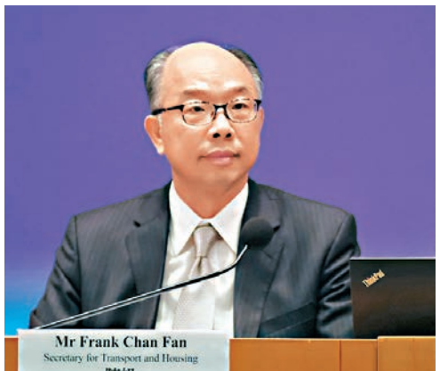
運房局局長陳帆舉行記者會,闡述施政報告他管轄範疇的措施。

香港文匯報訊(記者 翁麗娜、鄭治祖)施政報告提出交通費津貼,預計可令200萬市民受惠。運輸及房屋局局長陳帆昨日出席運房局與發展局的聯合簡報會時指,全港約有1,000萬張八達通卡流通,每月交通費超出2,000元的使用者僅約1,000餘人,不擔心有人濫用交通補貼計劃。他表示,目標是爭取未來3個月向立法會財務委員會申請撥款,並在通過撥款後的1年內落實計劃,日後並會作出檢討。