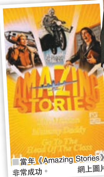
當年《Amazing Stories》非常成功。

當年《Amazing Stories》可說非常成功，全劇台前幕後吸引諸多大牌加入，演員有康城金球雙料影帝添羅賓斯，更有馬田史高西斯和奇連伊士活執導。不過分析認為，《Amazing Stories》在年輕人中知名度不高，未必可以吸引這批iPhone睇劇的主要觀眾。 ■《華爾街日報》