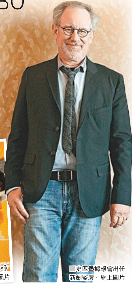
史匹堡據報會出任新劇監製。