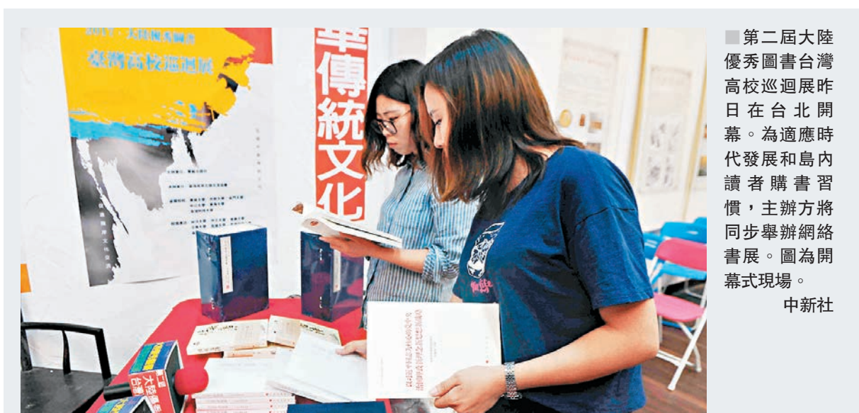
第二屆大陸優秀圖書台灣高校巡迴展昨日在台北開幕。為適應時代發展和島內讀者購書習慣，主辦方將同步舉辦網絡書展。圖為開幕式現場。

中評社的快評則指出，沒有「一中」的「四不」，本質、虛實講不了人，善意、承諾不能當真。順應歷史潮流，放下「台獨」的意識形態，追求兩岸人民共同的福祉，才是真正的善意，才是真正不走回對抗的老路。