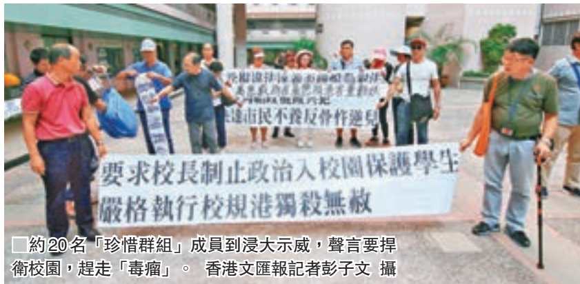
約20名「珍惜群組」成員到浸大示威，聲言要捍衛校園，趕走「毒瘤」。