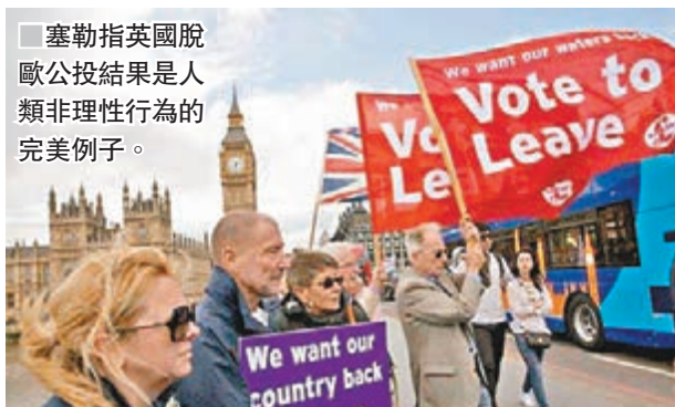
塞勒指英國脫歐公投結果是人類非理性行為的完美例子。