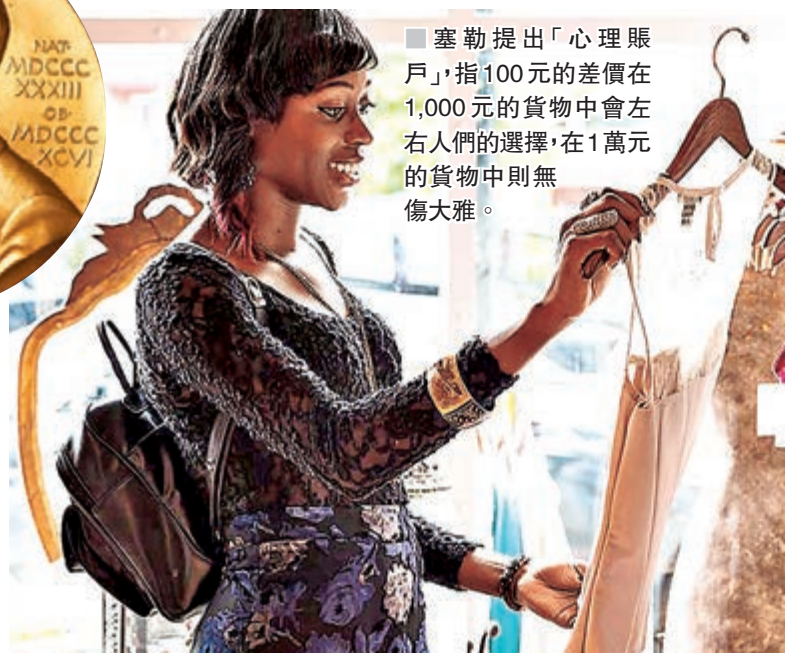
塞勒提出「心理賬戶」，指100元的差價在1,000元的貨物中會左右人們的選擇，在1萬元的貨物中則無傷大雅。