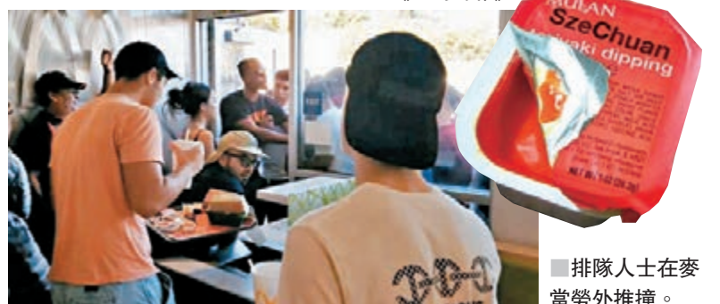
排隊人士在麥當勞外推撞。