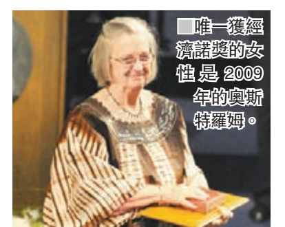
唯一獲經濟諾獎的女性是2009年的奧斯特羅姆。