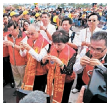
昨日，福建湄洲媽祖金身結束在台巡安活動，不少信眾來道別。中新社

香港文匯報訊 據中新社報導，福建湄洲媽祖金身結束在台巡安活動，於昨日13時8分起駕回湄，搭乘海峽號返回湄洲島。