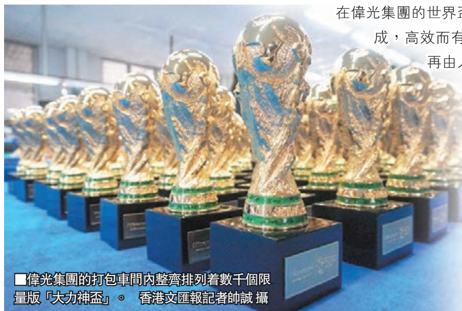
偉光集團的打包車間內整齊排列着數千個限量版「大力神盃」。

在偉光集團的世界盃產品生產流水線上，限量版紀念金盃的製作一氣呵成，高效而有序。全自動模具將金屬原料快速打磨成型，粗成品再由人工打磨邊縫，通過電泳漆線後便成為一枚金光閃閃的紀念盃。香港文匯報記者帥誠 東莞報導