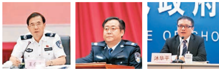
夏崇源 網上圖片 何挺 資料圖片 沐華平 資料圖片

香港文匯報訊 據中新社報導，中央紀委官網昨日發佈消息，公安部原黨委委員、政治部主任夏崇源，重慶市政府原黨組成員、副市長，市公安局原黨組書記、局長何挺，重慶市政府原黨組成員、副市長沐華平被處分。三人都被指「嚴重違反政治紀律和政治規矩」。三人之中，夏崇源因嚴重違紀受到留黨察看兩年、行政撤職處分；何挺因嚴重違紀受到開除黨籍、行政撤職處分；沐華