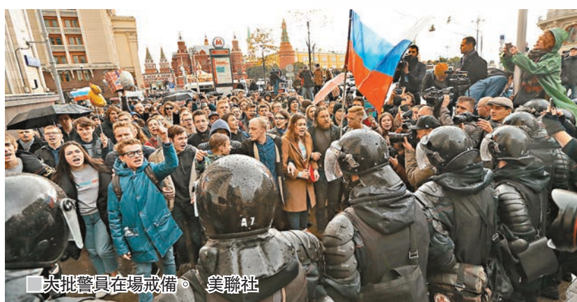
大批警員在場戒備。