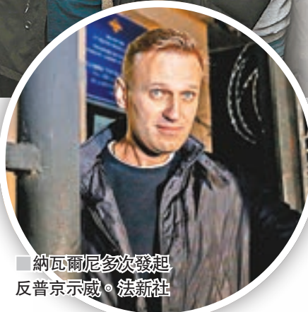
納瓦爾尼多次發起反普京示威。

俄羅斯總統普京昨日迎來65歲大壽，雖然65歲是俄羅斯法定退休年齡，但已經執政長達18年，普京顯然無意退休，更很大機會參加明年3月大選，繼續掌權最少6年。反對派領袖納瓦爾尼昨日號召支持者在全國80多個城市示威，抗議普京持續掌權，並要求讓納瓦爾尼參與大選。莫斯科當局禁止集會，警告參與者將會被捕。