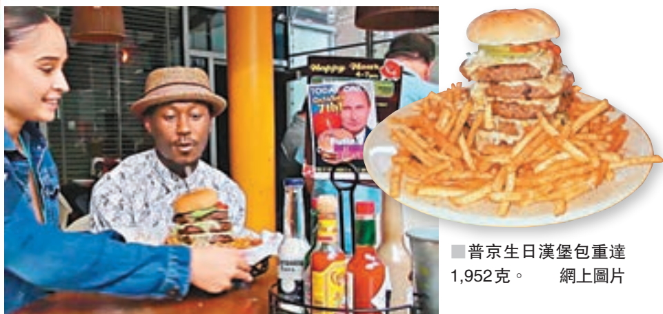
■普京生日漢堡包重達1,952克。網上圖片