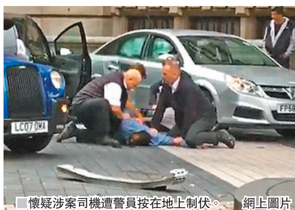
懷疑涉案司機遭警員按在地上制伏。 網上圖片

英國倫敦南肯辛頓區的著名旅遊點自然歷史博物館外，昨日有汽車剷上行人路，多人走避不及被撞倒受傷，懷疑涉案司機事後遭警員按在地上制伏。警方發言人證實拘捕一名男子，正調查事件動機及評估是否涉及恐怖襲擊。