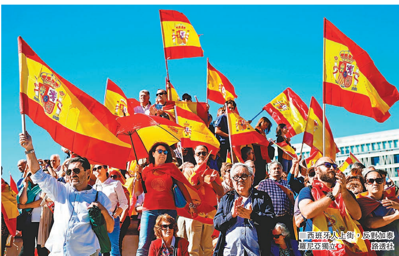
西班牙人上街，反對加泰羅尼亞獨立。