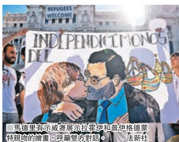
馬德里有示威者展示拉霍伊和普伊格德蒙特親吻的繪畫，呼籲雙方對話。

獨派支持者之間亦出現反對單方面宣佈獨立的聲音，一位教授表示不希望西班牙出現內戰，另有學者稱加泰社區已響起「警鐘」。數千名西班牙民眾昨日在馬德里和巴塞羅那舉行示威，呼籲透過對話化解危機，示威者響應主辦團體號召，穿上白衣出席，並高呼「我們能否對話？」的口號。馬德里另有群眾集會，支持國家統一及反對加泰獨立。