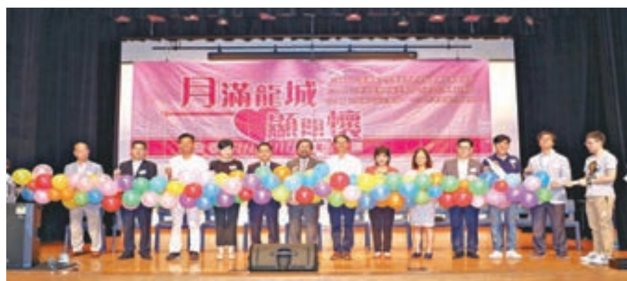
「月滿龍城顯關懷」活動，賓主主持啟動儀式。

香港文匯報訊（記者 鄧學修）九龍城區各界慶祝香港回歸祖國活動委員會日前假紅磡社區會堂舉行「月滿龍城顯關懷」活動。