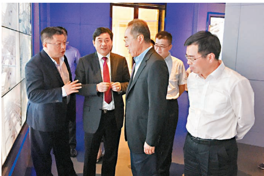
唐英年一行參觀考察中國碳谷科技集團。

據介紹，作為祝塘「石墨烯小鎮」培育建設的主體，中國碳谷集團首批七十台年產120噸的石墨烯產業化生產線正處於建設之中，預計將於今年年底投入運營。集團負責人特邀唐英年參加主禮將於今年年底舉行的落成開工儀式，唐