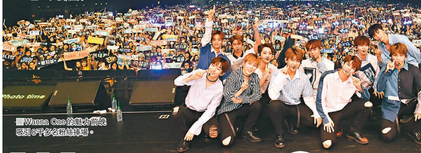
Wanna One的魅力前晚吸引8千多名粉絲捧場。