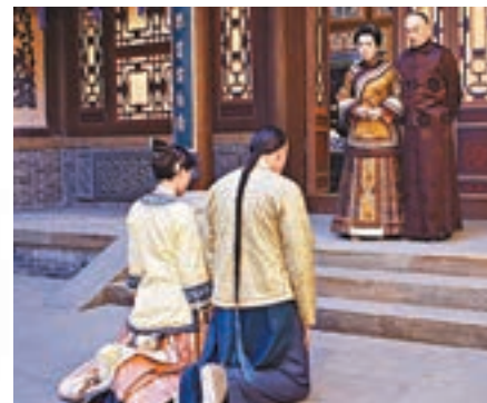
劇中龔慈恩飾演孫儷的奶奶。