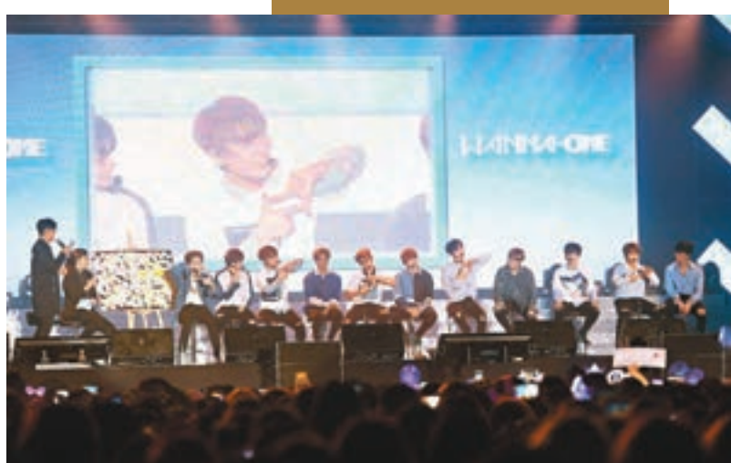
各成員出畫法寶霖粉絲。