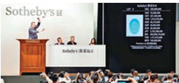
■北宋「汝窯天青釉洗」瓷碗拍出逾2.9億元港幣的世界紀錄。

前天蘇富比當代中國畫拍賣亦引致收藏家熱捧。蘇富比中國畫部主管張超群表示,兩幅備受矚目的鉅構——李可染《千岩競秀萬壑爭流》及傅抱石《西山夜渡圖》不負眾望,在藏家激烈競爭下創出驕人成績,李可染六尺山水巨幅《千岩競秀萬壑爭流》以1億2,200萬港元成交,傅抱石《西山夜渡