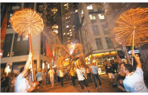
■300人舞火龍隊伍巡遊。

他指以往舞火龍不會設有鐵馬,市民可參與追趕火龍,近年愈來愈多人來觀賞,為了確保公眾安全在道路兩旁架設了大量鐵馬,少了親密感。