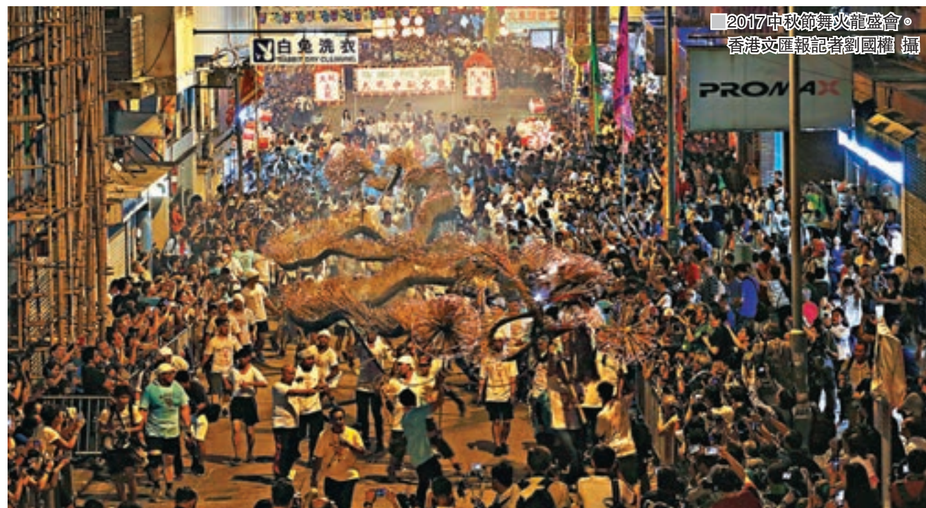
■2017中秋節舞火龍盛會。

香港文匯報訊(記者 岑志剛)擁有逾百年歷史、被列為國家級非物質文化遺產的大坑舞火龍昨天首日巡遊。約300名大坑居民或前居民組成隊伍,於大坑舞動長達67公尺插滿長壽香的火龍,穿梭大坑的大街小巷,吸引大批市民和旅客特地到場觀賞。有市民大讚氣氛熱鬧,亦有外國旅客慕名而來,在一睹火龍真身後嘖嘖稱奇,高呼「Amazing!」