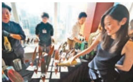
■「宇宙」汽酒雞尾酒。

香港文匯報訊(記者 翁麗娜)第九屆美酒佳釀巡禮將於本月26日起一連四日在中環海濱舉行。旅發局節目及旅遊產品拓展總經理洪忠興昨日表示,今年設有約400個攤位,較去年稍減10個,主要考慮過去兩年有入場市民反映黃金時段人流太多,為免影響體驗,旅發局今年不會特別追求人數增長,預計有14萬人入場,與去年相若,估計當中一成半是遊客。