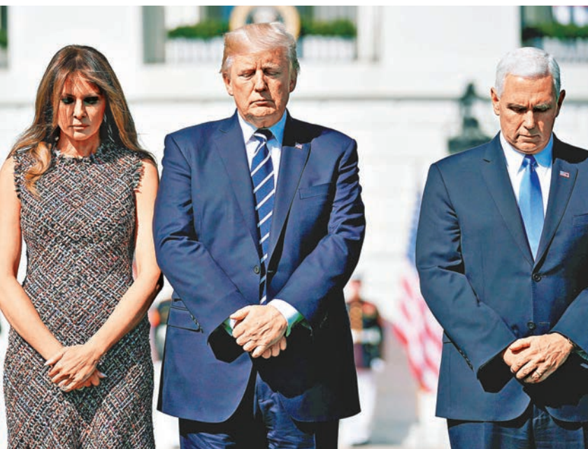
特朗普與夫人梅拉妮亞及副總統彭斯等，為死難者默哀。