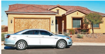
警方搜查帕多克住所。