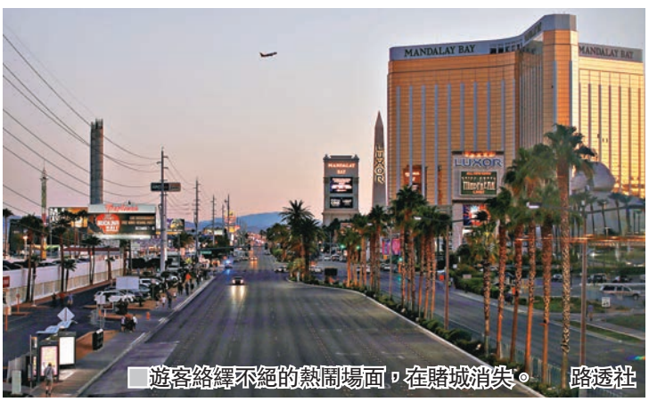
遊客絡繹不絕的熱鬧場面，在賭城消失。