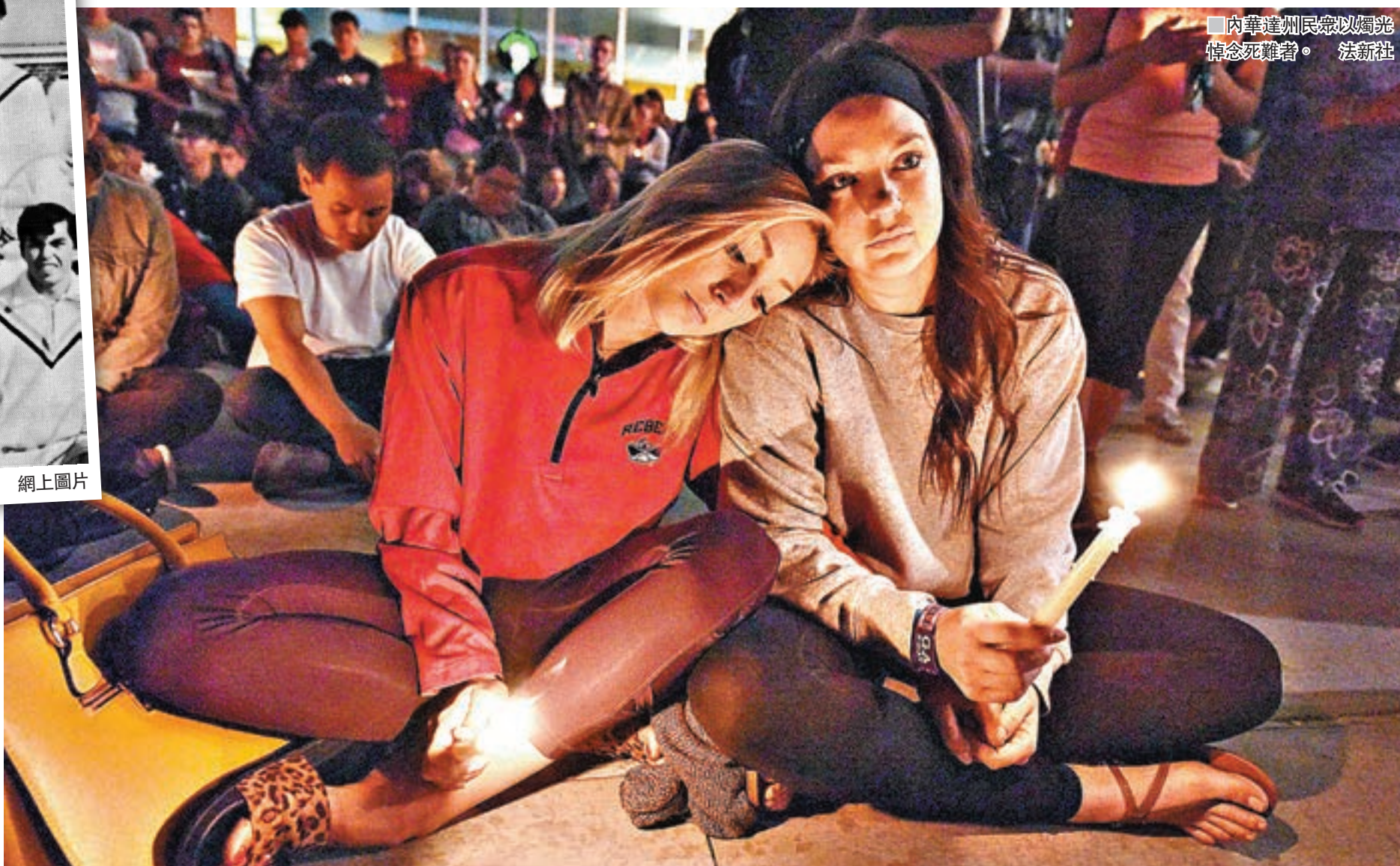
內華達州民眾以燭光悼念死難者。