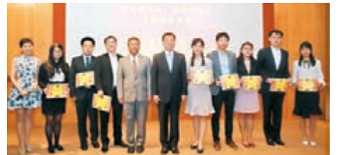
外交部駐港特派員公署舉行「永遠跟党走，喜迎十九大」主題演講比賽。

香港文匯報訊(記者 鄭治祖)據外交部駐港特派員公署網站昨日載，9月29日，公署舉行了「永遠跟党走，喜迎十九大」主題演講比賽。外交部駐港特派員謝鋒，副特派員楊義瑞、胡建中等出席並擔任評委。謝鋒指出，是次比賽很有意義，一是重溫理想，堅定信念；二是進一步统一思想，明確方向；三是樹立新風，凝聚力量。