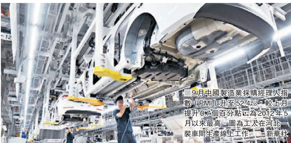
9月中國製造業採購經理人指數（PMI）升至52.4%，較上月提升0.7個百分點，為2012年5月以來最高。圖為工人在河北一裝車間生產線工作。

中信證券首席經濟學家諸建芳則預計，從PMI和高頻數據來看，9月經濟數據或好於預期。由於房地產週期下行、環保政策負面影響，以及「50號文」和「87號文」對地方政府基建投資的限制，三、四季度經濟增速比上年上半年將會有小幅回落，中國經濟仍然有