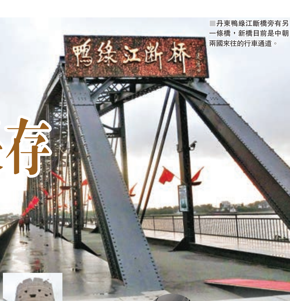
丹東鴨綠江斷橋旁有另一條橋，新橋目前是中朝兩國來往的行人通道。

遼寧省人民政府副秘書長史建新致辭時表示，遼寧與港澳地處不同區域，歷史、人文環境迥異，資源差異明顯，產生合作空間潛力巨大。瀋陽和大連兩市分別進行了旅遊推介，人文風景、美食資源豐富。隨着2022年北京冬奧會的臨近，遼寧冰雪旅遊將會受到更多港澳居民的青睞。遼寧省旅遊發展委員會發佈了港澳遊客赴遼旅遊獎勵政策，並與香港旅遊業議會、澳門特區政府旅遊局簽署了合作備忘錄。遼寧省4家旅行社與港澳4