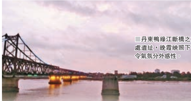
丹東鴨綠江斷橋之處遺址，晚霞映照下 令氣氛分外感性。

若對中國東北三省地理位置不熟悉的人，可能不會知道丹東是七東東，但當再講她是與朝鮮的新義州隔江相望，你就可能明多一點，加上近期被稱為「火箭人」的朝鮮領導人金正恩與美國的狂人總統特朗普日日搞沒有硝煙的戰爭隔空開「口水戰」，金正恩又不時試射導彈嚇人。會否令你多了點興趣去丹東遊玩一下？當你親身踏足丹東，你發現當地人如常生活，沒有半點緊張，問他們怕不怕？他們說：「不用怕，快來買樓，月亮島的新大樓仍有貨，這裡沒限購令。」哈哈！很好的心態，他們不會覺得導彈會掉下來，戰爭會發生；更重要的是他們相信國家的防衛設施能保護到他們。