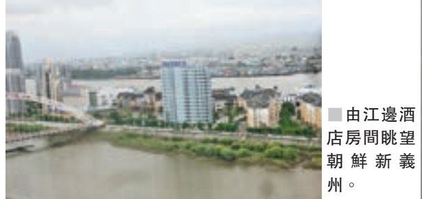
■ 由江邊酒店房間眺望朝鮮新義州。