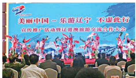
「美麗中國—樂遊遼寧 不虛此行」活動現場。

香港文匯報訊（記者 焯鈴）聯合國世界旅遊組織第22屆全體大會剛於9月中旬在成都召開，國家主席習近平向大會致賀詞時指出，旅遊是不同國家、不同文化交流互鑒的重要渠道，是發展經濟、增加就業的有效手段，也是提高人民生活水平的重要產業。中國高度重視發展旅遊業，旅遊業對中國經濟和就業的綜合貢獻率已超過10%。預計未來5年，中國將有7億人次出境旅遊。同時中國擁有悠久歷史、燦爛文化、壯美山川、多樣風情，也有信心吸引更多國際遊客來華旅遊。