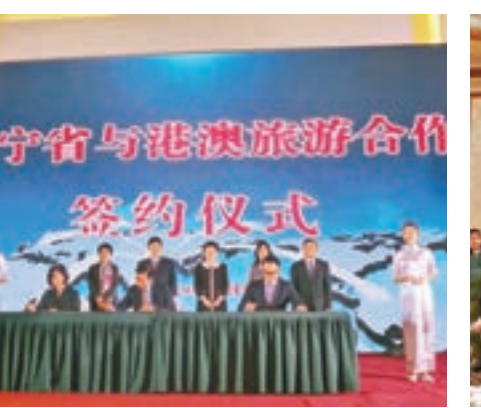
遼寧省旅遊發展委員會與港澳特區政府旅遊部門簽署《旅遊合作備忘錄》。