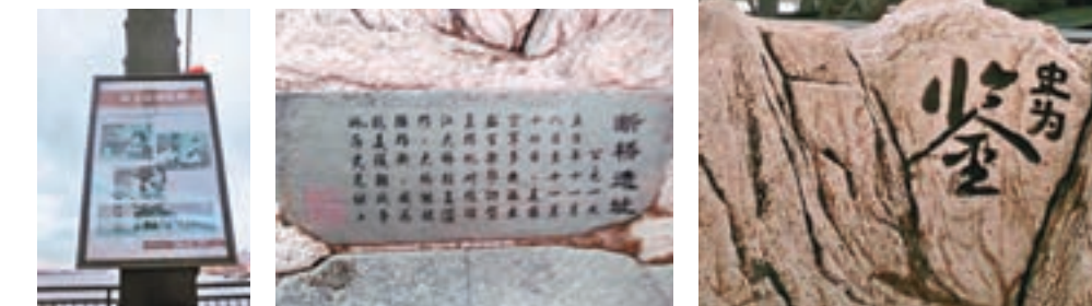
丹東鴨綠江斷橋上之歷史圖片