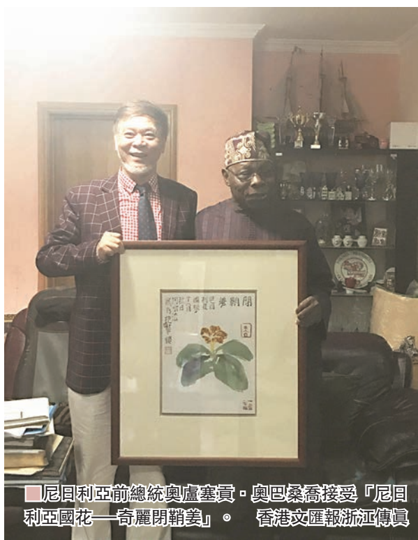
尼日利亞前總統奧盧塞貢與奧巴桑喬接受「尼日利亞國花——奇麗閉鞘美」。