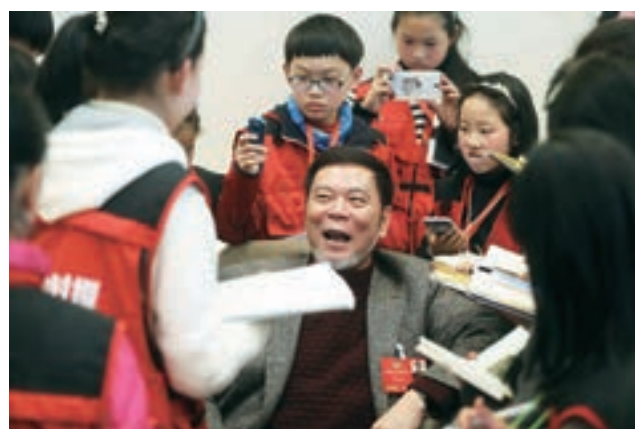
2016年3月2日，全國政協委員何水法在駐地接受小記者採訪。

「此外，政府還需要扶持與激勵廣場舞曲目與舞蹈的創作，比如結合當地的傳統舞蹈與戲劇劇目，發展與激活地方戲曲，讓瀕臨滅絕的地方傳統戲曲與舞蹈找到新的生路等。」何水法相信，在有關部門的政策引導下，結合強大的國力支持，廣場舞完全有可能在未來打造成一張中國的名片。