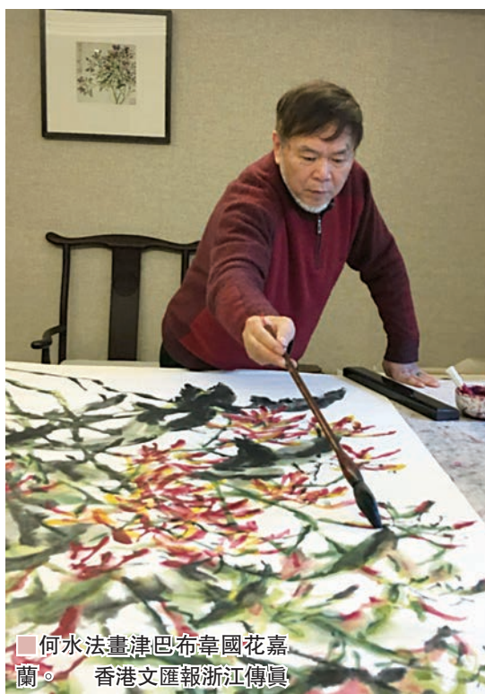
何水法畫津巴布韋國花嘉蘭。香港文匯報浙江傳真