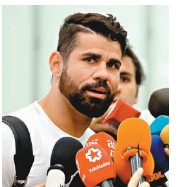
迪亞高哥斯達回流西班牙賽場。