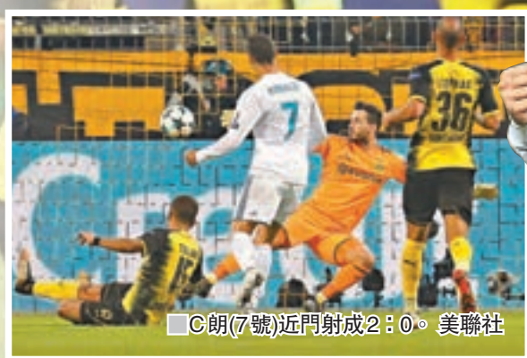
C朗(7號)近門射成2：0。