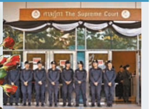
■最高法院昨日就英祿(左圖)「大米瀆職案」宣判，出動大批警員駐守。

泰國最高法院昨日就「大米瀆職案」宣判，指前總理英祿明知政府推行的收購大米計劃非法，但未有制止，裁定她瀆職罪成，判囚5年。