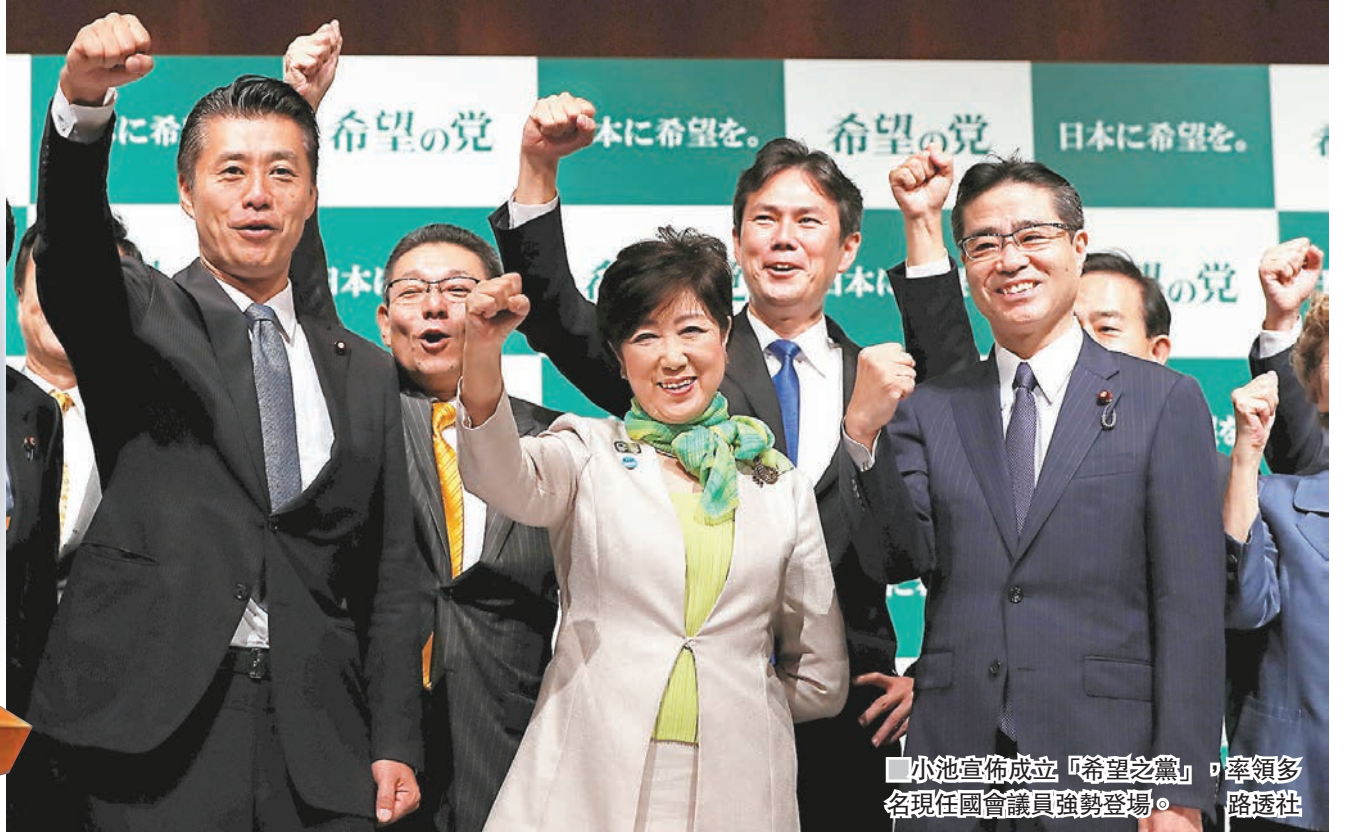
■小池宣佈成立「希望之黨」，率領多名現任國會議員強勢登場。