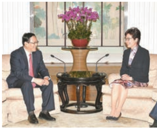
林鄭月娥與李強會面。

她續說，香港與浙江省均希望配合國家「一帶一路」建設，期望香港與浙江省包括寧波市，在港口物流業務、高端的海事服務和其他專業服務方面加強合作，共同把握「一帶一路」建設帶來的