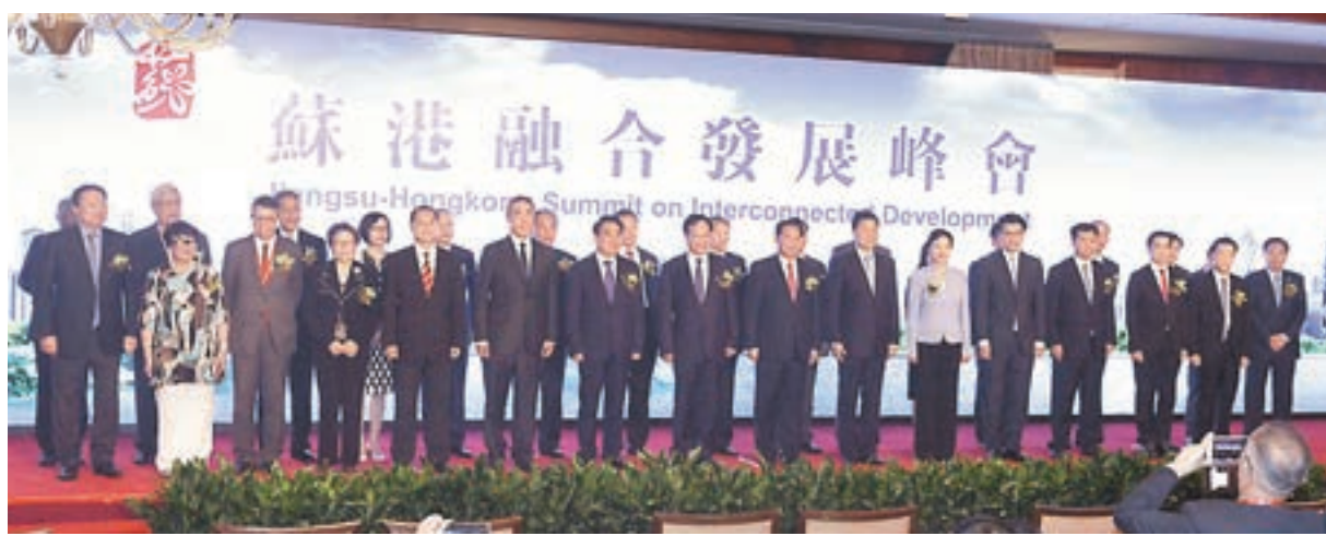
首屆蘇港融合發展峰會昨日在港舉辦，江蘇省委書記、省人大常委主任李強、中聯辦副主任陳冬等賓主合照。

香港文匯報訊(記者 陳旻)首屆蘇港融合發展峰會昨日在港舉辦，江蘇省委書記、省人大常委主任李強作主旨演講。他表示，作為蘇港深化交流合作的制度性安排，峰會將會定期舉辦，以進一步搭建兩地交流合作的高端平台，促進優勢互補、互利共贏。他希望兩地立足已有的基礎和平台，着力拓展合作空間，開啟蘇港融合發展的嶄新未來。