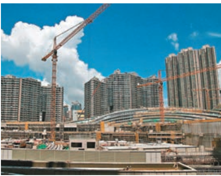
高院法官昨頒下判詞，指現階段提出司法覆核言之尚早，遂拒絕受理有關申請。圖為高鐵香港段地盤。