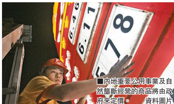
內地重要公用事業及自然壟斷經營的商品將由政府來定價。資料圖片