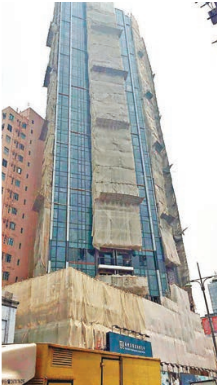
■THE PARKVILLE 劃出15伙單位作大學畢業生計劃,入場單位售價588萬元。

新世界前日落實提供旗下屯門 THE PARKVILLE 的15個單位作大學畢業生計劃,當中最便宜的單位售價588萬元。據了解,集團正研究向大學畢業生提供「超低首期」的安排,以8%首期計,買家僅需付47萬元便可上車,餘下92%可全數向新世界承按揭。集團亦會代買家繳付3.75%的印花稅,變相助買家減省約15萬元。