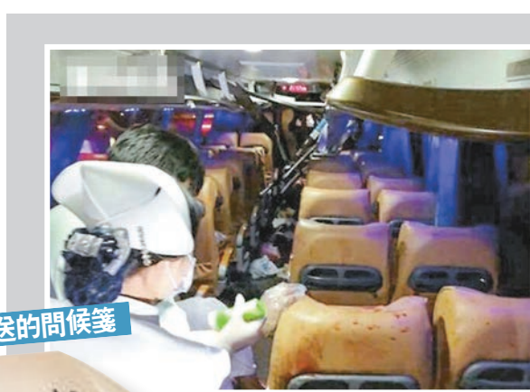
中聯辦主任王志民致送慰問信