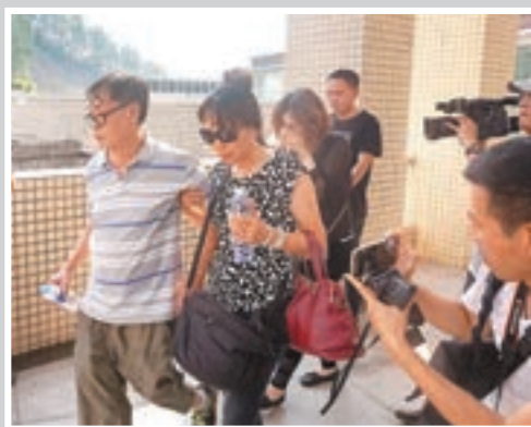
死者家屬趕到廣州番禺殯儀館。