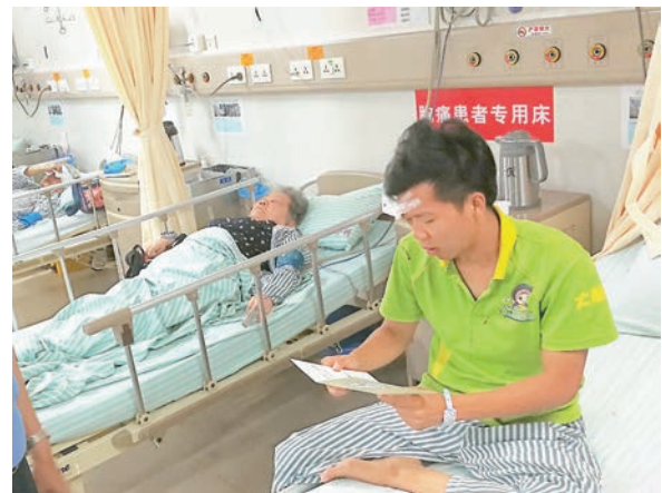
香港旅行大巴事故中的導遊在閱讀慰問信。

據廣州警方昨晨最新通報,25日晚19時44分許,廣州鏡湖高速南二環東行79千米處,發生一宗一輛粵牌大客車與一輛湘牌中型貨車碰撞的交通意外。事故造成2人死亡(香港籍),多人受傷。據悉,遭遇車禍的香港旅行團,除了司機和導遊外,其餘均為香港居民,其中有多位中老年人。不幸身故的兩名港人為一男一女的60歲以上長者,9名受傷港人仍需分別在番禺區中心醫院、廣州市第一人民醫院南沙分院救治。其他32名團友已經獲安排回港。