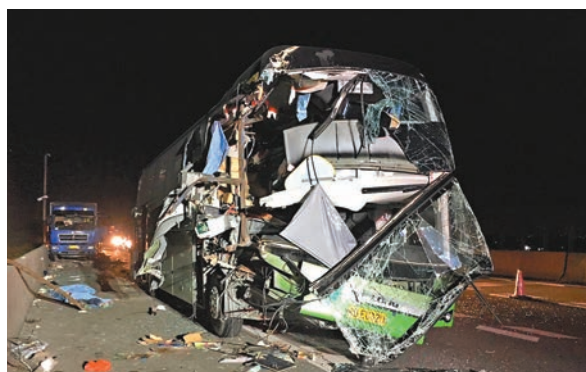
大客車被撞至變形。