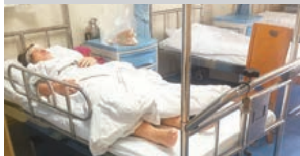
傷者在醫院接受治療。