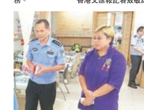
旅行社人員與當地警方在處理事件。