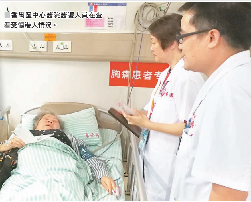
番禺區中心醫院醫護人員在查看受傷港人情況。