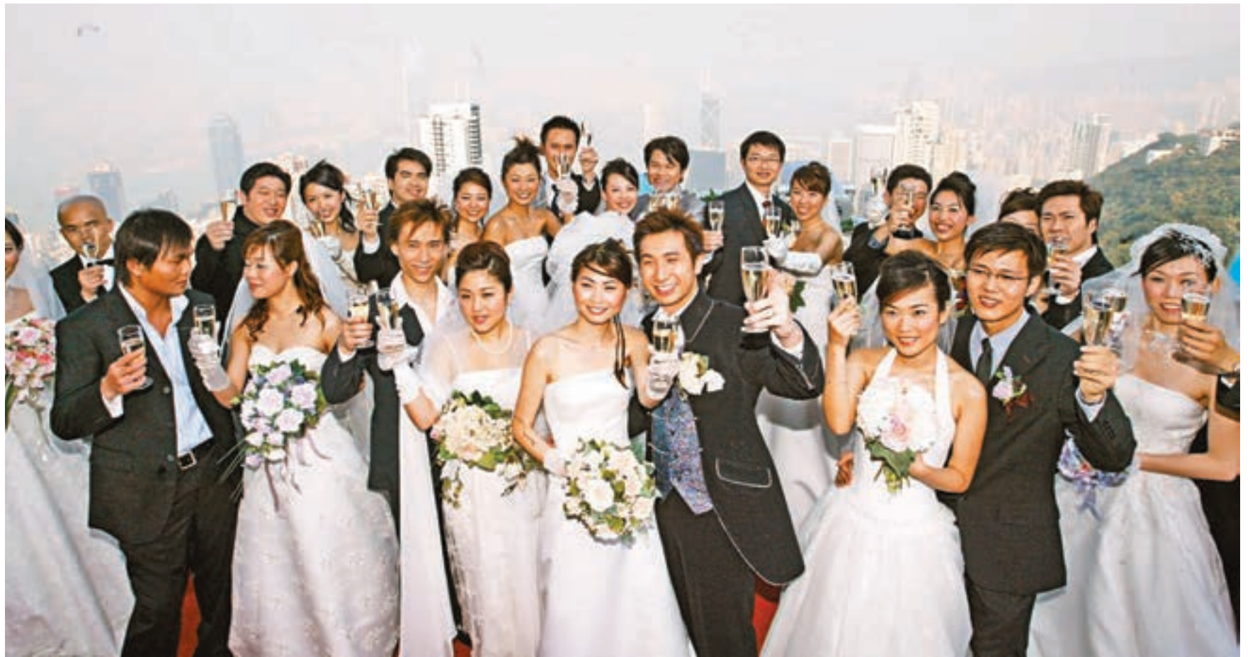
逾半數跨境婚姻受訪者表示,樂意考慮在大灣區包括香港、廣東及深圳等鄰近城市定居。

她期望港人能加以尊重及包容,不再標籤及歧視新來港人士,並以客觀、正面的態度看待兩地關係及未來的共同發展。