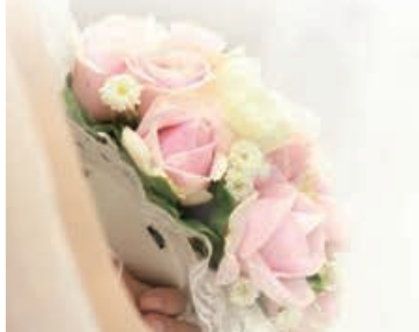
香港文匯報記者 文森

該研究報告指出,對內地人來說,即使其家境不算好,在內地的住屋面積也有數百呎,有受訪者直言「在廣州父母間屋,間間地都2,000(方)呎。」比一般港人的居所寬敞得多,令內地配偶來港後,很難適應日常生活,且容易與身邊人產生磨擦。