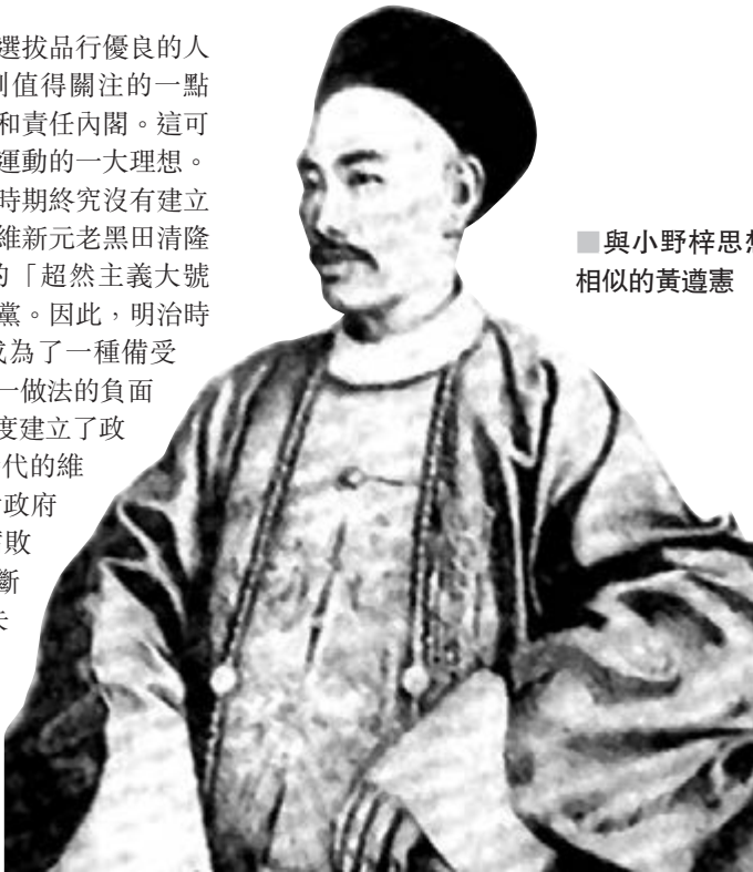
與小野梓思想相似的黃遵憲