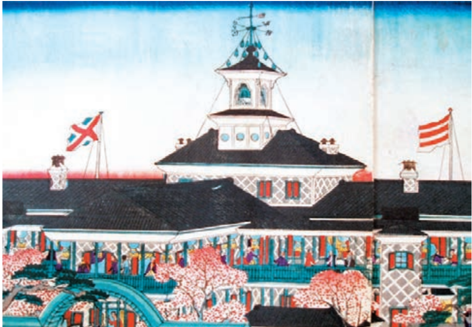
明治維新時期的日本

回到日本的小野梓，面對的是明治維新時期，日本國內有關未來國體的爭論風潮。主張建立立憲民主政治的自由派發起了聲勢浩大的自由民權運動，與專權的明治政府進行對抗。如果從制度變革的角度來看，自由民權運動本身也是日本明治維新的一部分。只不過，這一改革的發動者在民間而非官方。深受英國民主制思想熏陶、身為公職人員的小野梓與後來成為首相的大隈重信一道，也參與了這一運動。他成立了啟蒙大眾的團體「共存同聚」，向民眾宣講民主思想。但在1881年，日本政府開除了主張立即建立民主政治的大隈重信一派，史稱「明治政變」。小野梓以辭職表達抗議。當時的政府對小野梓有諸多刁難和監控，但信仰「知識救國」的小野梓仍不放棄，在1882年協助大隈重信建立了東京專門學校，也就是今日著名的早稻田大學。1883年，小野梓為了弘揚「良書普及」的理念，用知識啟蒙日本民眾，宣告成立東洋館書店，也就是今日著名的富山房前身。1886年，小野梓因為肺炎去世，結