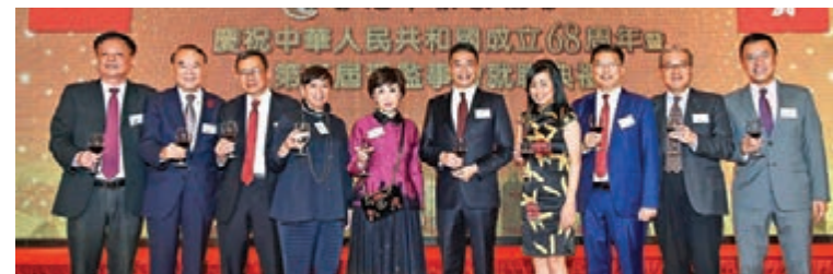
■選舉委員會批發及零售界選委親臨到賀