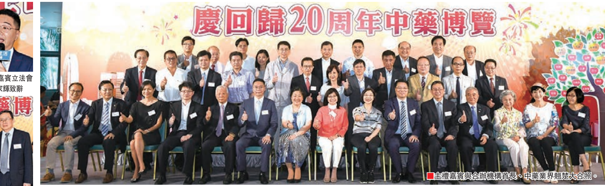
■主禮嘉賓與合辦機構首長、中藥業界翹楚大合照。

「慶回歸20周年中藥博覽」日前假鑽石山荷里活廣場成功圓滿舉行,一連2天的活動吸引了逾千市民參與,並一致讚賞,大力要求再次舉辦同類型活動。