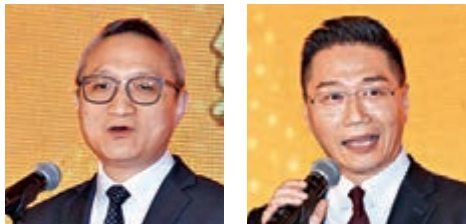
■主禮嘉賓署理食物及衛生局局長徐德義及立法會議員邵家輝致辭