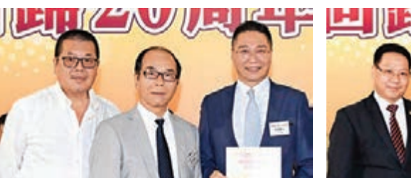
■立法會議員邵家輝(右一)擔任主禮嘉賓並接受感謝狀