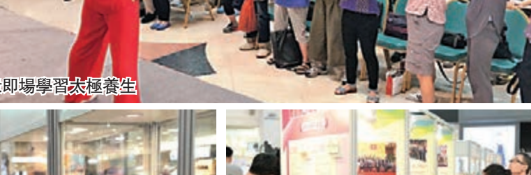
■主禮機構印刷的「中藥養生小冊子」深受市民歡迎。