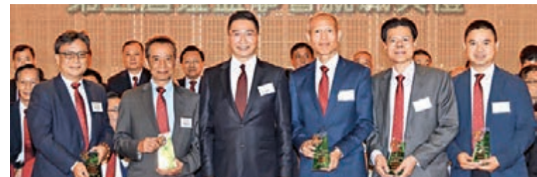
■立法會議員邵家輝頒發創會會長感謝紀念品