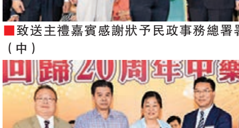
■致送主禮嘉賓感謝狀予九龍工作部副部長盧寧(中)