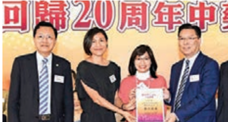
■致送主禮嘉賓感謝狀予食物及衛生局常任秘書長謝曼怡(中)