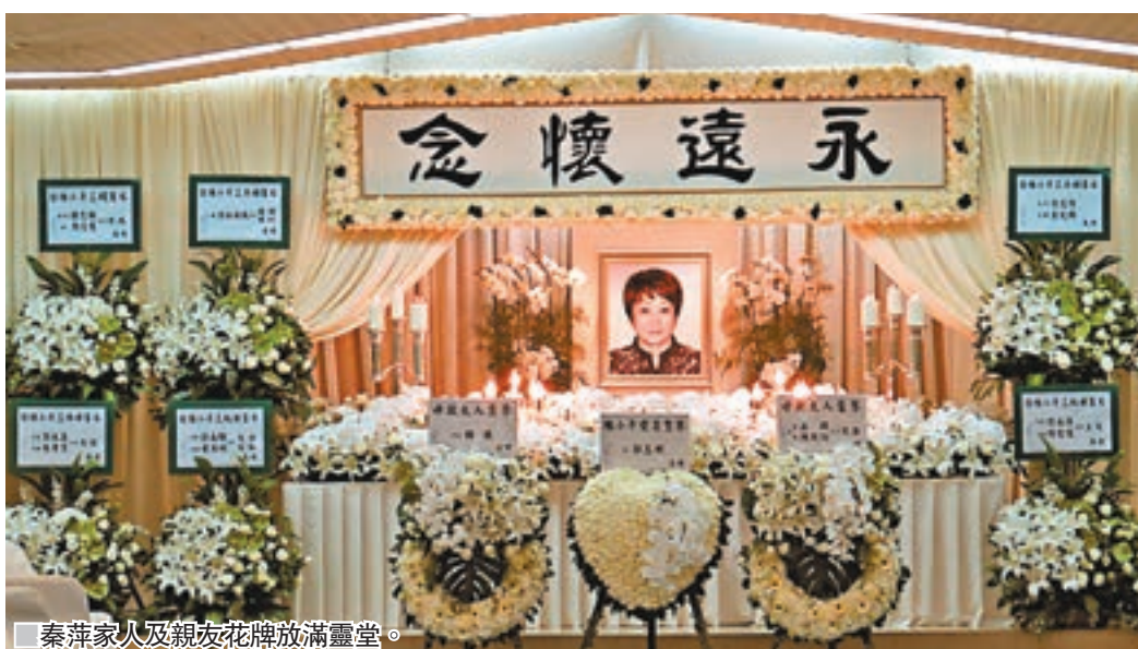
秦萍家人及親友花牌放滿靈堂。

香港文匯報訊 韓國天團BIGBANG成員太陽今晚假亞博館舉行「White Night World Tour」演唱會。前晚太陽在馬尼拉開完強後，即搭通宵機來港，為今晚的港騷做準備。風塵僕僕的太陽難免面露疲態，戴上口罩遮倦容。雖然太陽昨早約7時半已飛抵香港，但仍有粉絲晨早到機場接機。公認是暖男的太陽之後脫下口罩自拍，將自拍照放上社交網站，他先答謝馬尼拉的粉絲，然後再問港迷準備好迎接今晚騷了嗎，靚盡兩地粉絲！