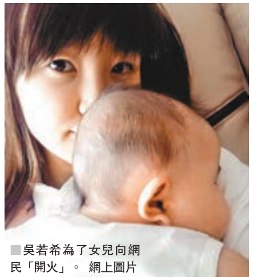
吳若希為了女兒向網民「開火」。