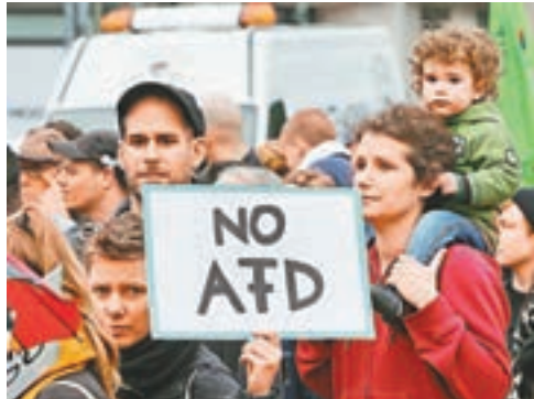
■有選民向AfD說不。