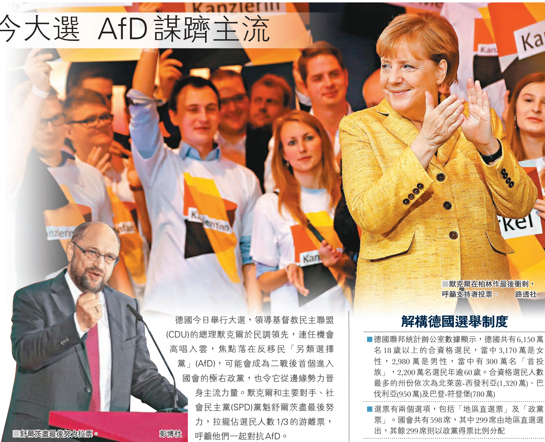
■默克爾在柏林作最後衝刺，呼籲支持者投票。