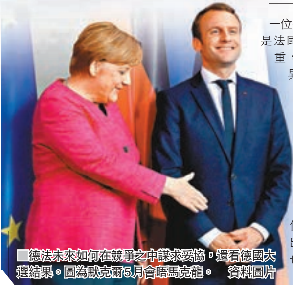
■德法未來如何在競爭之中謀求妥協，還看德國大選結果。圖為默克爾5月會晤馬克龍。

一位是西方國家任期最長的總理，一位是法國最年輕的總統，默克爾老成持重，馬克龍大膽進取，他們作風迥異，卻關係密切，目標只有一個，就是重振歐洲。8年前歐債危機爆發，德國掌控大局，主導對「歐豬國」的援助和經濟改革，並在近年難民問題挺身而出，令她儼如救世主。如今馬克龍冒起，長期以來歐洲的「德國獨大」權力結構有機會迎來變動。德國在歐洲領導地位屹立不倒，固然有賴其持續經濟增長、出口產業蓬勃和穩定政局，同時也拜外部環境所賜。首先是德國