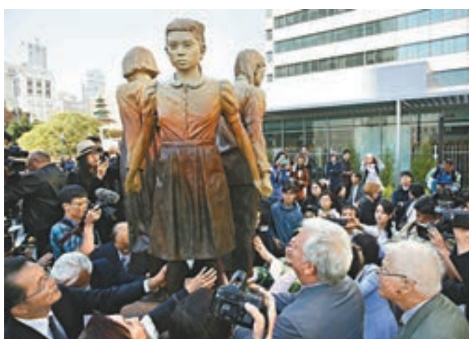
慰安婦銅像首次豎立於三藩市華埠。