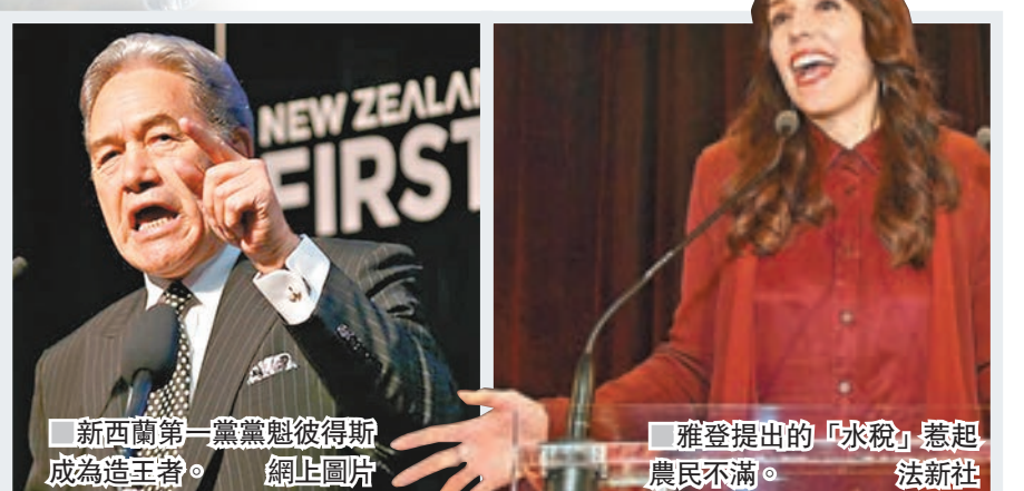
新西蘭第一黨黨魁彼得斯成為造王者。