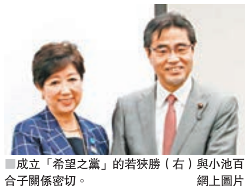
成立「希望之黨」的若狹勝(右)與小池百合子關係密切。

與日本東京都知事小池百合子關係密切的眾議員若狹勝等人，有傳決定成立新政黨，並命名為「希望之黨」，小池可能兼任黨職，具體職務視乎未來政治形勢發展而定。 日本放送協會報道，鑑於首相安倍晉三將於下周四舉行的臨時國會上宣佈解散國會，若狹勝及前環境大臣細野豪志等人，加速準備成立新政黨事宜，預計在國會解散前一天，即下周三舉行記者會，正式宣佈成立。 小池百合子去年為備戰今夏舉行的東京都議會選舉，認為創造一個對未來抱有希望的社會有其