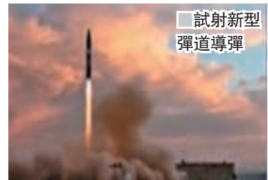
試射新型彈道導彈

在美國總統特朗普威脅退出伊朗核協議之際，伊朗官方電視台昨日公佈一段成功試射新型彈道導彈的影片，並引述軍方表示，導彈射程達2,000公里，能攜帶多枚彈頭，將很快投入實戰部署。 電視台沒透露導彈試射時間、地點和實際射程等細節。伊朗首都德