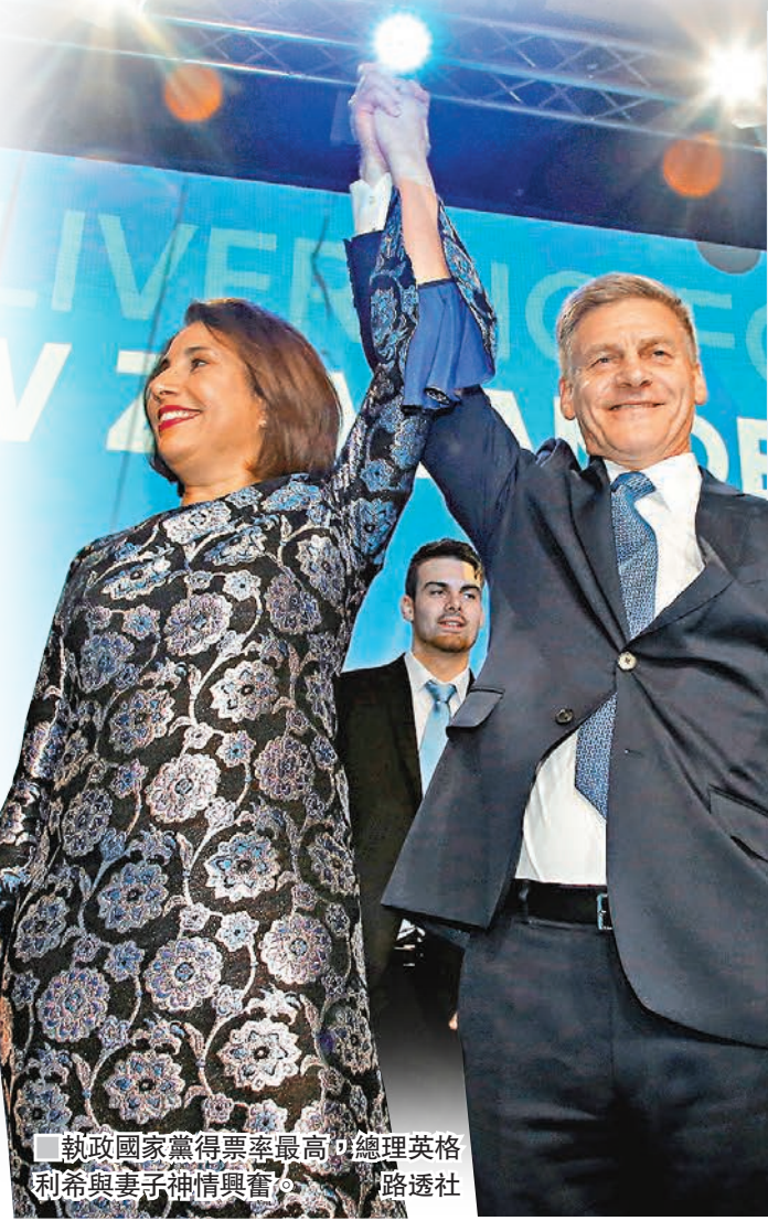
執政國家黨得票率最高，總理英格利希與妻子神情興奮。