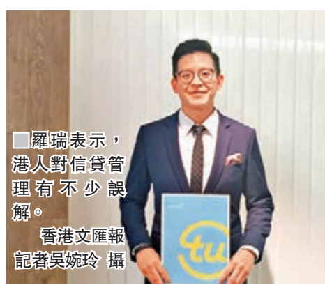
羅瑞表示，港人對信貸管理有不少誤解。

香港文匯報訊(記者吳婉玲)不少香港人都習慣使用信用卡付款，環聯調查發現，51%受訪者認為開立新信用卡賬戶時最重要的考慮因素是優惠及折扣，其次是消費現金回贈(47%)及迎新禮品(45%)。只有小部分受訪者會把安全性(39%)、信用額(22%)及利率(17%)列作申請新卡時的三項首要考慮之一。