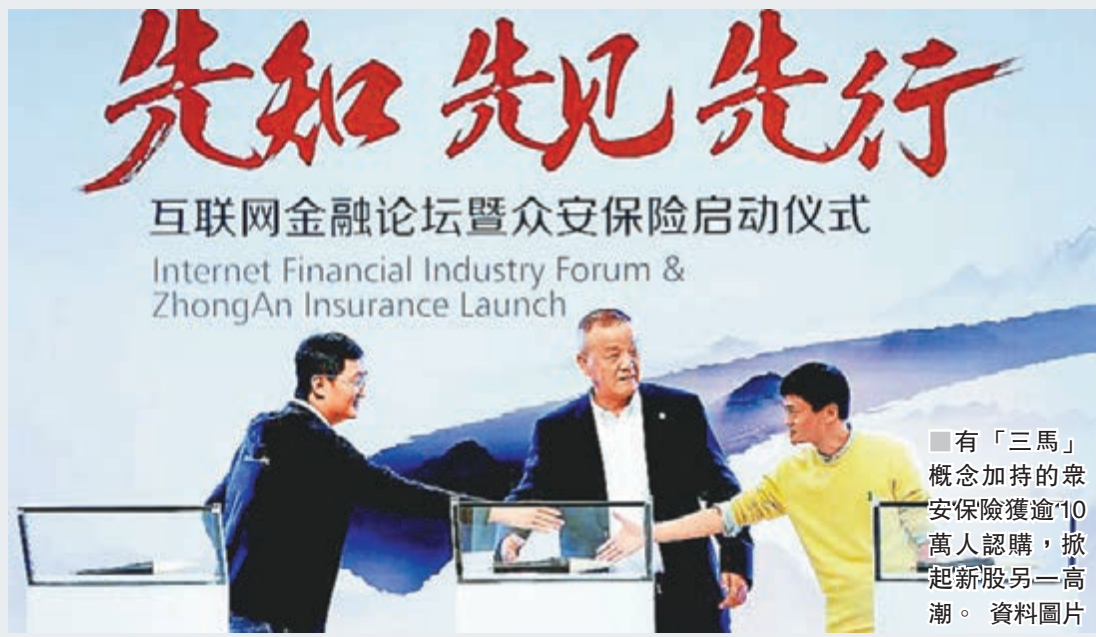
有「三馬」概念加持的眾安保險獲逾10萬人認購，掀起新股另一高潮。

香港文匯報訊 港股企穩於28,000點，新股表現亦水漲船高。有「三馬」概念加持的眾安保險(6060)，昨日中午12時正式截飛。昨晚有市場消息指，該股獲逾10萬人認購，認購資金約2,000億元，相當於超額認購近400倍，成為近兩年多以來凍資額最多的大型新股。